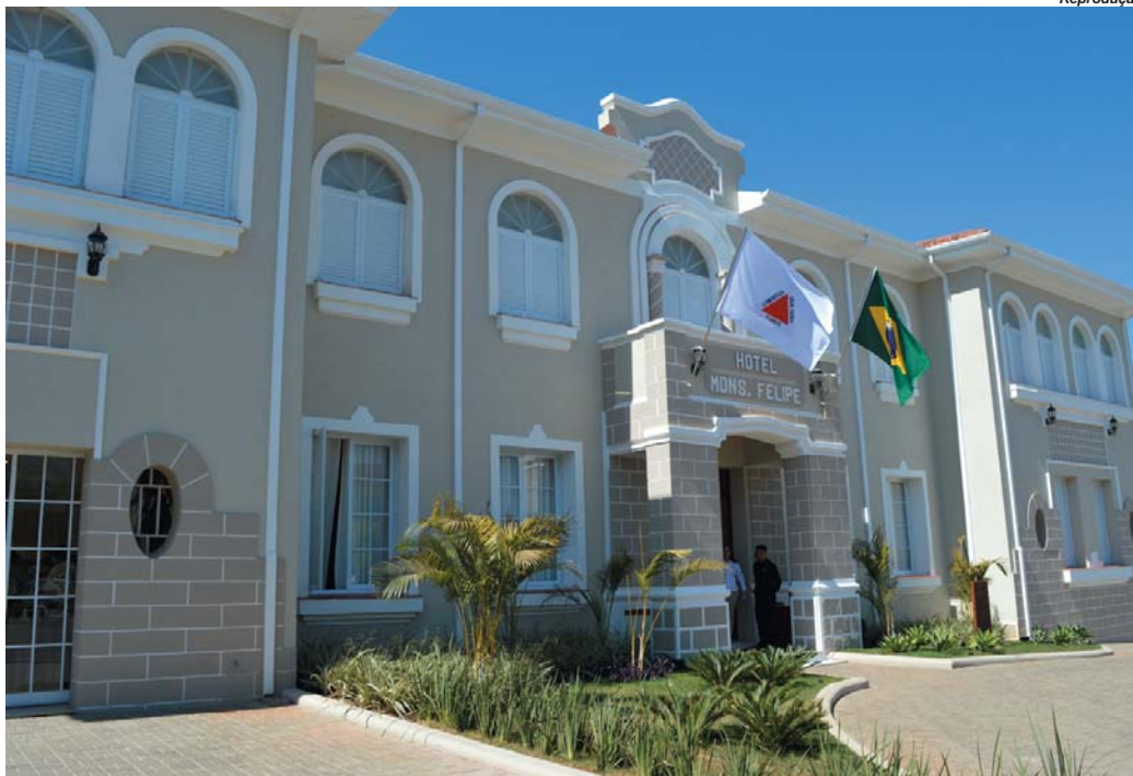
São Sebastião do Paraíso avança na preservação do Patrimônio Cultural com atualização de inventários: antigo Seminário do Sion, prédio do Instituto Monsenhor Felipe e Escola Estadual Paraisense

ACISSP promove shows, Campanha de Natal e eventos no mês de dezembro