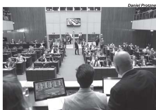
Propostas aprovadas pelo Plenário procuram ampliar assistência a pessoas mais vulneráveis

O texto altera a Lei 10.501, de 1991, que dispõe sobre a po-