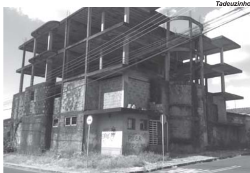
Obra inacabada há mais de três décadas, além de proporcionar um visual horroroso, incomoda e preocupa moradores das imediações, na Vila Sta Maria.