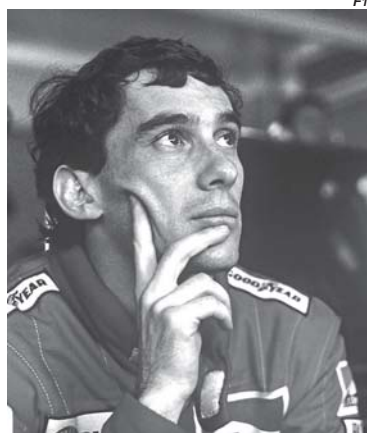
Ayrton Senna permanece vivo na memória e no sentimento das pessoas mesmo trinta anos após a sua morte

Senna iria assumir o carro do francês em 94, mas com o fim da eletrônica embarcada, a Williams perdeu força. Foi como se tivesse cortado as suas asas. E o sonho de pilotar o melhor carro, de vencer todas as corridas virou pesadelo com o modelo FW16. Durante os testes de pré-temporada, Senna previu que aquele seria um ano de muitos acidentes na F1 porque sem a eletrônica os carros estavam muito desequilibrados. A profecia se confirmou. Foi