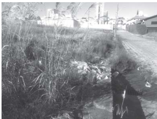
Parte da Rua José Paschoini está cheio de entulhos e matos, na Rua São Luiz, terrenos vagos cheios de matos e lixo, preocupa moradores do Bairro Santa Thereza, que faz divisa com o centro de Paraíso