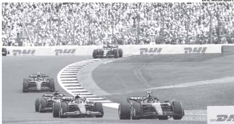
Não fosse o binômio, Red Bull-Verstappen, teríamos um campeonato equilibradíssimo

A F1 está em férias. Depois de uma primeira metade exaustiva, é hora de recarregar as baterias para o que vem pela frente. E será pauleira. Na volta, no último final de semana de agosto, até Abu Dhabi em 26/11, serão dez corridas em 14 semanas de um campeonato que praticamente já tem um campeão. A questão é apenas saber onde Max Verstappen irá carimbar o tricampeonato. O holandês vem assombrando a F1 com uma sequência interminável de vitórias dele e da Red Bull. Já são 8 vitórias seguidas de Max que não sabe o que é perder uma corrida, ou Sprint desde o dia 7 de maio, em Miami. Falta uma para ele igualar o recorde de maior número de vitórias consecutivas na F1 que pertence a Sebastian Vettel, em 2013, com a mesma Red Bull que na Bélgica atingiu a inimaginável sequência de 13 vitórias seguidas (12 em 2023), pulverizando a marca que pertencia à McLaren que em 1988 ganhou 11 corridas consecutivas com Ayrton Senna e Alain Prost.