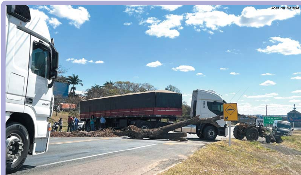
Joel na Balada

Depois de bloqueado por mais de 3 horas trânsito é liberado na BR 491 em Paraíso