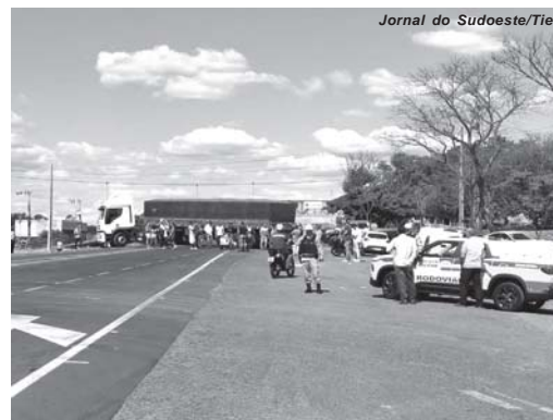
Jornal do Sudoeste/Tiel