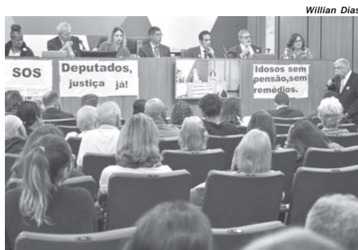
Aposentados e pensionistas da Minascaixa queixaram-se das dificuldades após suspensão dos benefícios

O advogado avalia não haver argumento jurídico para afirmar que o plano ficou sem patrocinador. Segundo ele, o Estado absorveu, não só o trabalho e o conhecimento dos funcionários, mas também o grande patrimônio da Minascaixa, na forma de inúmeros