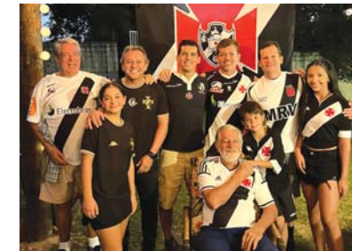
Vascaínos da família