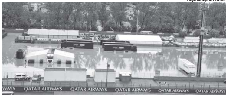
A F1 que já deu de ombros para muitas coisas que acontecem ao redor do mundo, desta vez foi sensata em cancelar o GP numa região em estado de calamidade

O mais longo calendário da história da F1 com 24 corridas programadas, sofreu a segunda baixa: o GP da Emilia Romagna que seria disputado neste final de semana em Imola, foi cancelado por conta das fortes chuvas que tem caído nos últimos dias e causado inundações, mortes, perdas e danos à população na região norte da Itália.