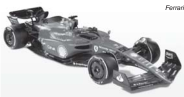
O belo F1-75, novo carro da Ferrari para esta temporada da F1

O bom disso tudo é que desde a criação da F1 em 1950, apenas seis vezes uma corrida foi encerrada antes de completar 75% da distância total. Portanto, estatisticamente é algo raro de acontecer.