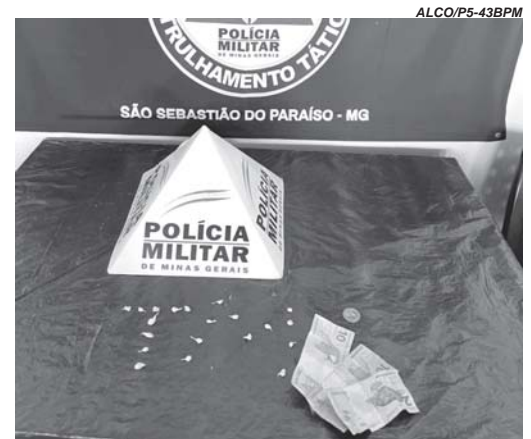
Dois homens são presos, e materiais apreendidos encaminhados para a delegacia juntamente com os suspeitos de tráfico

A Polícia Militar apreendeu dois menores e prendeu dois homens durante patrulhamentos nos bairros Nossa Senhora Aparecida e Jardim Alvorada, em São Sebastião do Paraíso, quinta-feira (27/1), por tráfico de drogas.