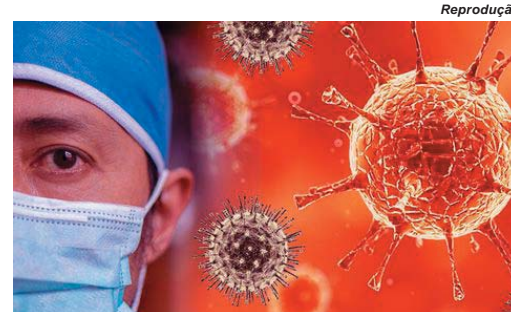
Psicólogo paraense avalia e comenta sobre a situação da covid-19

Ele acredita que a população de maneira geral colaborou ‘muito’ em relação a pandemia. “Existem os ideais individuais e grupais, onde muitos ultrapassaram um certo limite, porém, é algo que não aconteceu somente aqui, em todo Brasil tiveram essas frustrações”, cita.