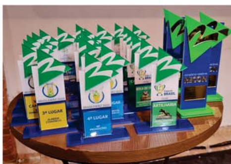
Premiação campanhas de vendas 2020 e 2021