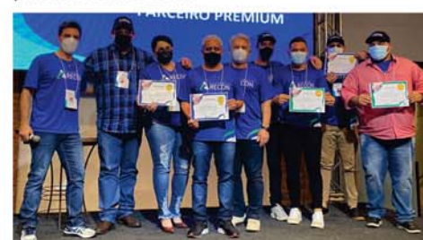
Campeões de Vendas

Oportunamente agradece a todos os paraisenses que, de uma forma ou de outra, participaram desta história.