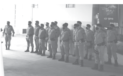
Novos cabos receberam divisas e foram alertados sobre as novas responsabilidades