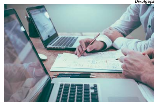
Na pandemia atendimento on line supera fronteiras para oferecer ajuda a quem precisa de apoio

Ele reforça que a terapia on line surte os mesmos resultados de uma terapia presencial e ainda possui algumas vantagens. “A pessoa pode fazer de qualquer lugar desde que tenha privacidade. Você não precisa se deslocar e, pode fazer no conforto de sua