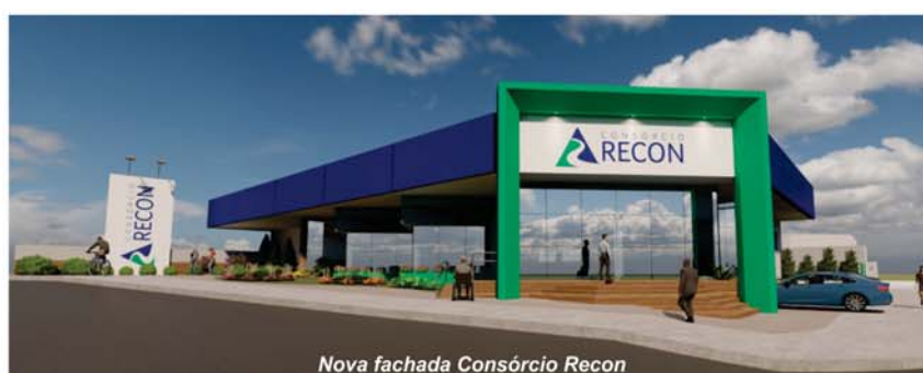
Nova fachada Consórcio Recon

www.consorciorecon.com.br consorcionalrecon consorcioconoficial/ faleconosco@consorcioconoficial.com.br Av. Dárcio Cantieri, 1.750 - (35) 3539-8150 São Sebastião do Paraíso - Minas Gerais