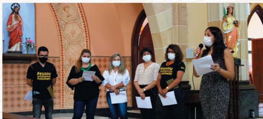
Celebração dos 97 anos do Colégio Paula Frassinetti.

... agora temos de agradecer muito ao senhor e perdí-lhe muito, muito que continue a derramar as misericórdias sobre esta casa.