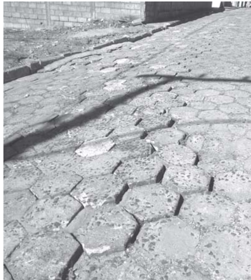
Moradores na rua Padre Benatti, no loteamento Savigny Soares, não estão satisfeitos com remendo no calçamento feito pela Copasa