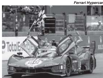
Ferrari Hypercar Ferrari conquistou de forma dramática o bicampeonato consecutivo nas 24 Horas de Le Mans

A Ferrari que se perdeu no final de semana do GP do Canadá chegou a Barcelona motivada pela segunda vitória consecutiva da divisão de endurance nas 24 Horas de Le Mans conquistada de forma dramática no último final de semana. Pouco menos de duas horas para a bandeirada, o modelo 499P com o numeral 50 li-