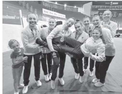
Com a seleção brasileira, jovem ajudou a equipe a superar seus limites e conquistar a prata no Sul-Americano