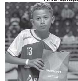
Melhores jogadores da partida

Na última semana o Paraíso Futsal entrou em quadra por inúmeras vezes e em várias categorias.