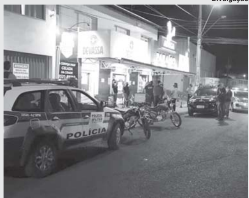
Forças de segurança estão realizando fiscalizações em estabelecimentos comerciais da cidade para evitar contágio da Covid-19

O Governo de Minas Gerais publicou na sexta-feira, 26, nova deliberação que ampliou as medidas restritivas para todos os municípios mineiros. A medida institui limitações em espaços internos para consumidores e afastamento de colaboradores com sintomas leves de gripe. Já em São Sebastião do Paraíso desde a quinta-feira, 25, através de um trabalho conjunto a Prefeitura, a Guarda Civil Municipal, a Polícia Militar e a Polícia Civil iniciaram a intensificação da fiscalização nas ruas e estabelecimentos para o combate ao coronavírus no município.