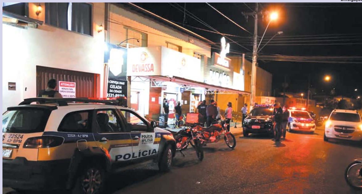
Forças de segurança estão realizando fiscalizações em estabelecimentos comerciais da cidade para evitar contágio da Covid-19

Cirurgias eletivas serão suspensas por tempo indeterminado