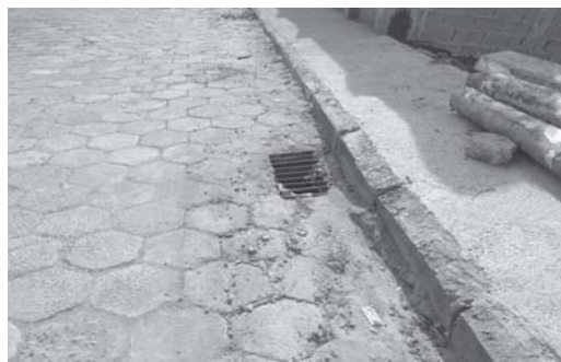
Prefeitura mandou consertar o Valetão da Rua Alfredo Fidelis Marques, mas precisa colocar no local mais e maiores bocas de lobo

De tanto moradores nas imediações do valetão e também condutores de veículos que transitam por lá solicitar, a Prefeitura por sua Secretaria