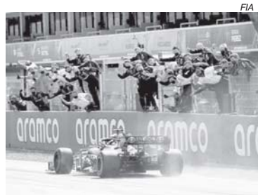
A Red Bull pintou como favorita, mas a Mercedes já venceu 3 dos quatro GPs até aqui

Essa não foi a primeira vez que a Mercedes pareceu estar na mira dos adversários, e como num passe de mágica, consegue se recuperar e impor toda a sua força. E não é por acaso que a Red Bull está contratando a peso de ouro profissionais importantes do staff técnico das áreas de chassis, motor e aerodinâmica da Mercedes. Com a saída da Honda já anunciada para o final desta temporada, a Red Bull vai passar a produzir o seu próprio motor, e daí a