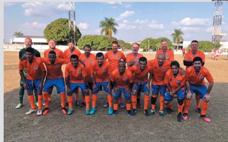
Equipe Pratapolense entra em campo para defender terceira posição na tabela

Duas partidas foram realizadas no final de semana válidas pela sexta rodada da primeira fase do Campeonato Quarentão. A equipe do TNB venceu mais um jogo e segue na liderança ocupando o primeiro lugar na tabela de classificação. Em seguida está a Associação Atlética Paraisense que também venceu seu compromisso e segue na perseguição do líder do campeonato.