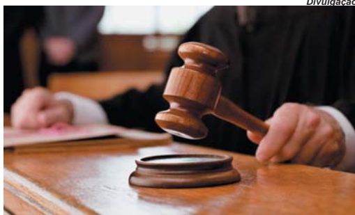
Tribunal de Justiça de Minas Gerais manteve decisão de condenação em primeira instância

De acordo com os autos, em 16 de janeiro de 2021, a professora e moradora da cidade então com 27 anos, adquiriu nas Lojas Americanas um equipamento que conjuga-