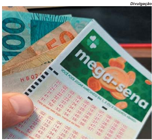
Apostadores tem às 19 horas desta quarta-feira para tentarem a sorte no próximo concurso milionário da Mega-Sena

Para uma aposta simples, com seis dezenas, o apostador deve desembolsar o valor de R$ 4,50. As apostas podem ser