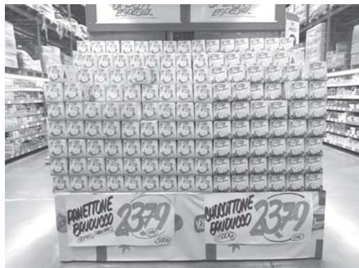
Panetones disponíveis para compra na Rede Tonin