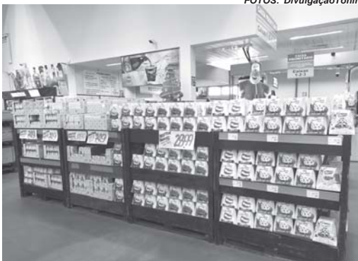
Rede Tonin oferece diversas opções de tamanhos e tipos de panetones

Faltam três meses para o Natal, mas quem for às lojas da Rede Tonin, um dos maiores grupos do ramo de atacarejo do Interior de São Paulo e Sudoeste de Minas Gerais ou acessar o e-commerce da empresa, encontrará diferentes marcas, tamanhos e sabores de panetones. Os produtos começaram a chegar desde o fim de agosto em virtude da antecipação das indústrias que fabricam panetone e a escolha em disponibilizar a mercadoria ao público é uma estratégia de vendas da empresa. "Cada ano que passa a indústria antecipa ainda mais a disponibilização do produto, a ideia é aumentar o volume de vendas e possibilitar que o cliente consuma o produto antes e durante o Natal. É uma iniciativa interessante porque as