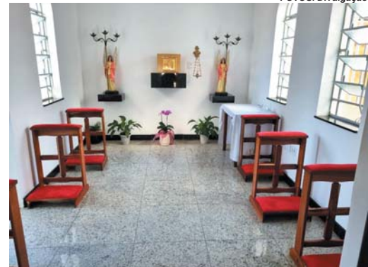
Adição de uma Capela do Santíssimo sem precedentes históricos também gerou desconforto entre fiéis