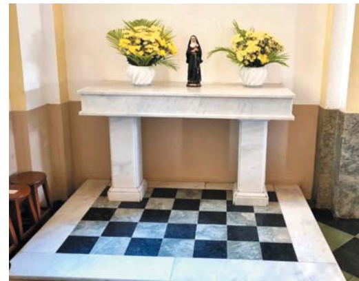
Antiga mesa do ambão, também de madeira do século passado, também foi trocada

Ele destaca, ainda, a importância do envolvimento dos órgãos públicos na preservação dos patrimônios. "Os órgãos públicos da cidade, em todos os níveis, são responsáveis pela conservação dos bens tombados. A Câmara Municipal, por exemplo, tem uma responsabilidade enorme com esses patrimônios", declara, cobrando uma postura mais ativa dos vereadores da cidade nessa questão.