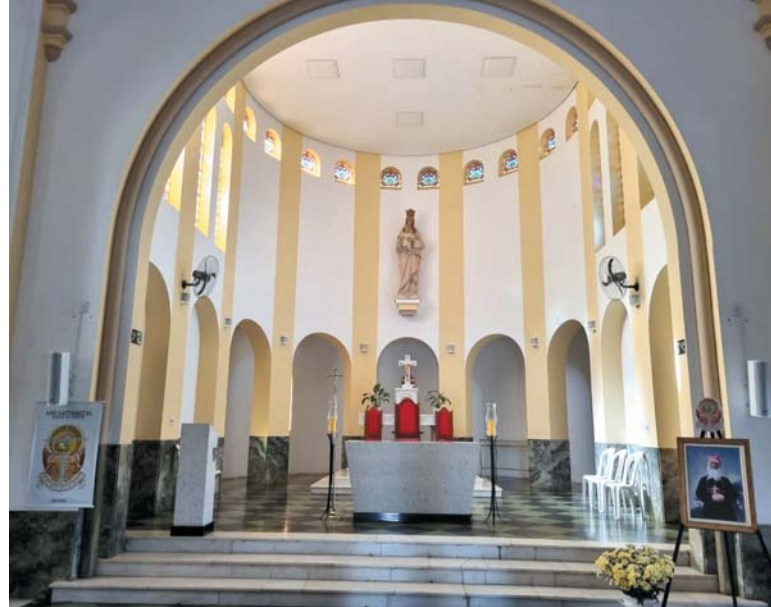
Mesa do altar, que era de madeira e oriunda da França na década de 1940, foi substituída por outra de granito

O historiador também relatou que o padre argumenta estar seguindo normas canônicas atuais, estabelecidas pelo Concílio Vaticano II na década de 50. No entanto,