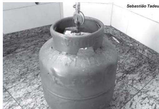
A porcentagem de aumento no preço do Gás de cozinha foi de mais de 2% superior do que da Gasolina, aumento este que vai sacrificar ainda mais famílias de baixa renda

Tomara que estes aumentos dos preços do gás e da gasolina não proporcionem elevação nos