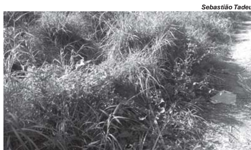
Matagal oferece riscos quanto a segurança e saúde de pedestres e principalmente aos moradores na Rua Estrada de Ferro e Av. Dr. Delfim Moreira 2

Moradores na Av. Delfim Moreira, e Rua Estrada de Ferro, onde foi feito da Fepasa, Centro de São Sebastião do Paraíso, mais uma vez entraram em contato com o Jornal do Sudoeste, para reclamarem de um antigo problema que está afligindo tanto os moradores e também pedestres que passam por ali. Referem-se ao matagal que se encontra na Rua Estrada de Ferro, via pública de terra batida que