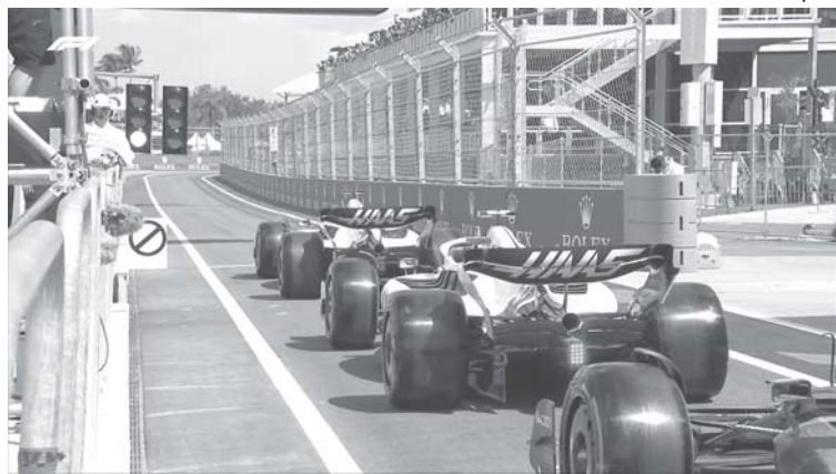
Experiência da Pirelli vai gerar economia de 160 pneus no GP da Hungria

Os pilotos da F1 estão diante de um grande desafio neste final de semana no GP da Hungria que marca a metade do campeonato, 11ª etapa de um total de 22 corridas depois que o GP da Emilia Romagna foi cancelado em abril por conta das fortes chuvas na região de Imola. A Pirelli está experimentando uma regra que era para ter sido testada em Imola e que se for aprovada deverá ser inserida ao regulamento dos próximos anos. Normalmente cada piloto recebe 13 jogos de pneus por fim de semana de corrida (2 jogos de compostos duros, 3 de compostos médios e 8 de compostos macios) para usar como quiser, lembrando que são obrigados a usar dois compostos diferentes na corrida.