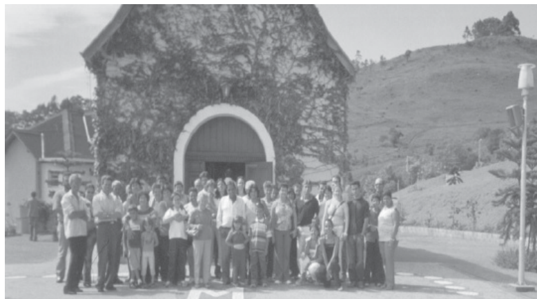
Grupo Renascer Santuário da Mãe Rainha em Poços de Caldas