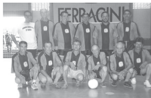
Time masculino de voleibol da 3ª idade - RENASCR