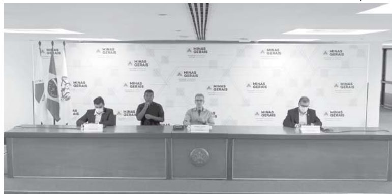
Pacientes com suspeita da doença poderão usar o aplicativo Saúde Digital MG para fazer consultas a distância

Romeu Zema explicou que em muitos países do mundo a consulta digital existe há mais tempo. "No Brasil, essa questão antes do aparecimento da pandemia sofria resistência. No entanto, ficou claro que