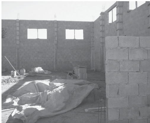
Construção da sede da Associação RENASCR