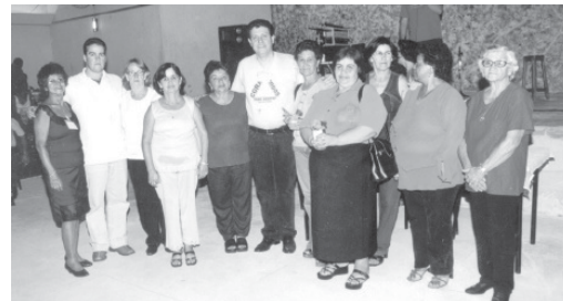
Grupo RENASCR em baile na cidade de Itaú de Minas

cas que fazem a diferença, fazendo-nos acreditar que nem tudo está perdido e que se cada um fizer a sua parte, o mundo será melhor, com o idoso ocupando lugar de honra, dentro da sociedade.