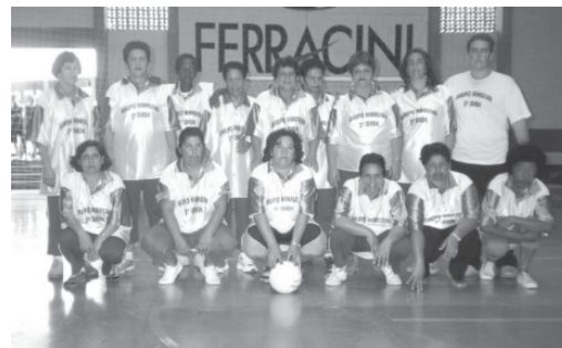
Time feminino de voleibol 3ª idade RENASCR