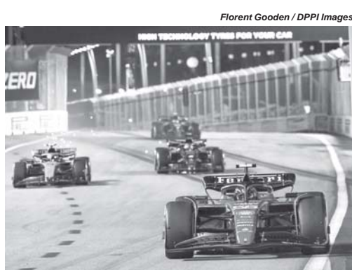
Carlos Sainz a caminho da brilhante vitória em Singapura na melhor corrida da temporada

tal como em 1988, coube novamente à Ferrari interromper uma série incrível de vitórias da Red Bull, como havia feito com a McLaren em Monza 35 anos atrás.