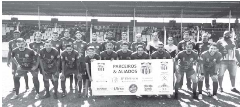
Parceiros e Aliados vencem Olhos d'Água e o calor de 34 graus e ficam com o título da Série B deste ano

Em seu primeiro ano com atividades no futebol de campo, equipe conquista o título e o acesso para a Série A de 2024