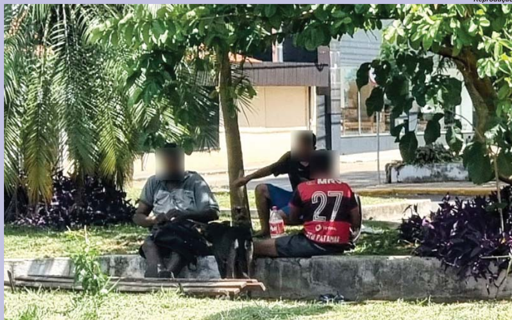
Grupo almoça e consome bebida alcoólica em uma praça da cidade