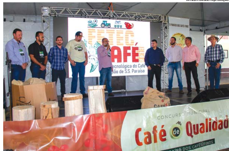
Foto da abertura da FETEC 2022. A solenidade de abertura da edição 2023 será nesta quarta-feira às 10 hs.

A FETEC Café, diferente da feira realizada no parque de exposições em maio desse ano, será somente destinada ao café, com tecnologias, insumos e produtos voltados para essa lavoura, além de outras atividades lúdicas e