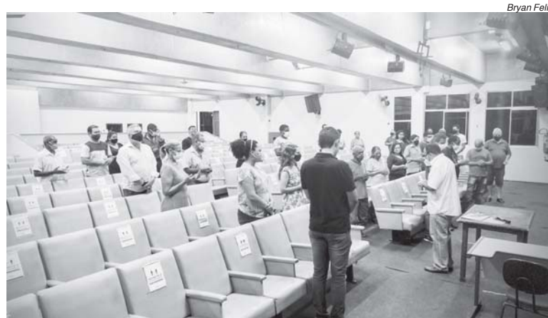
Congadas e Reinado somente em 2022, é o que ficou decidido em reunião nesta semana

“Chamamos vocês para ouvir a opinião dos representantes do reinado e dos ternos de congo e moçambique sobre a realização ou não dos desfiles da festa este ano, pois são