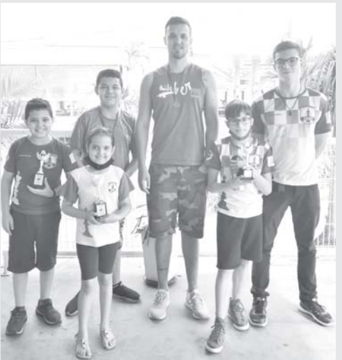
Equipe do CXSSP em Batatais/SP

Foi realizado, no dia 07/09/21, um torneio aberto de xadrez na cidade de Batatais/SP. Estiveram presentes 47 enxadristas de várias cidades da região. A competição foi disputada no sistema suíço em 5 rodadas. O ritmo de tempo foi 21 minutos nocaute. Seis atletas do Clube de xadrez de São Sebastião do Paraíso - CXSSP participaram da competição: