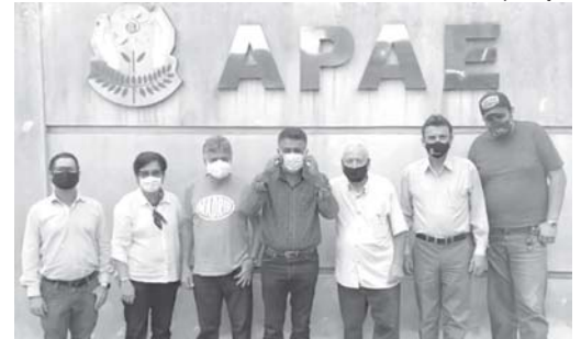
R$ 100 mil para a APAE

Na visita do deputado, também foram oficializadas as entregas de R$ 200 mil para o Hospital Gedor da Silveira, R$ 100 mil para a APAE e a liberação de recursos indicados no