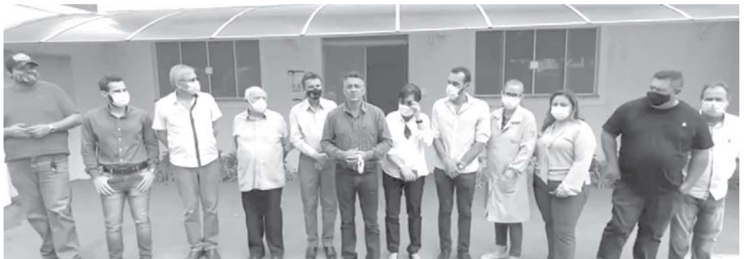
R$ 200 mil para o Hospital Gedor da Silveira