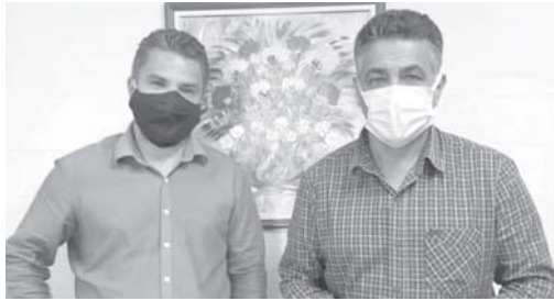
Prefeito Marcelo e o deputado federal Emidinho Madeira

O deputado federal Emidinho Madeira, presidente da Frente Parlamentar das Cirurgias Eletivas na Câmara Federal, em Brasília, esteve em São Sebastião do Paraíso, nesta sexta-feira (10), para anunciar a retomada das cirurgias eletivas após interrupção por causa da pandemia.