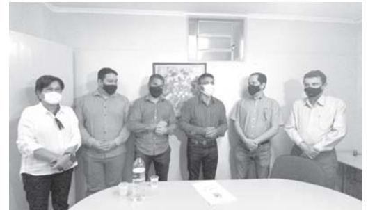
Santa Casa de Misericórdia de São Sebastião do Paraíso