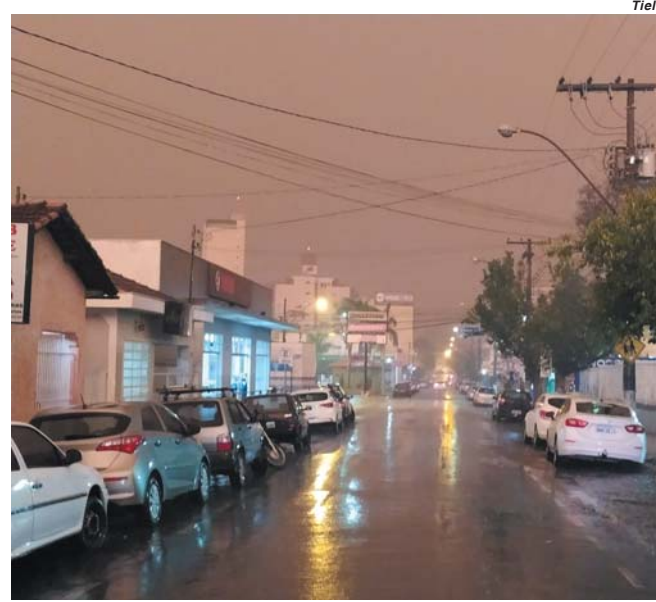
Cidade ficou às escuras no início da tarde de quinta-feira, até que choveu

Apesar do inverno a temperatura máxima no município chegou a 34 graus na sombra, com sensação térmica ainda maior. Em vários bairros quintais e o interior das casas ficaram cheios de fuligem. O cheiro da queimada permaneceu durante toda a noite.