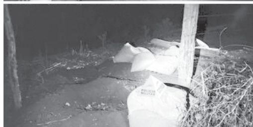
Denúncia anônima e atuação da Patrulha Rural impediu prejuízo de quase 10 mil Reais ao produtor de café

informações de que uma propriedade rural estava sendo furtada.