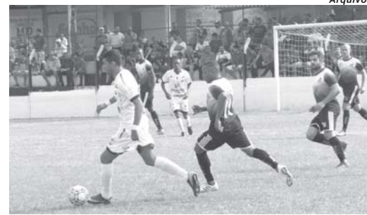
Depois do sucesso obtido na competição de 2019, são dois anos de espera e expectativas para a volta da equipe alvi negra aos gramados, superando o período de combate a pandemia do covid-19

Já são dois finais de semana que os jogadores estão se reunindo e sendo avaliados em vários aspectos. "É um trabalho sério e intenso para fecharmos o grupo e ver quem tem