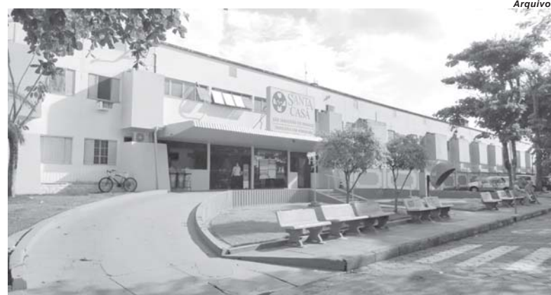
Hospital em Paraíso enfrentou grave crise financeira entre 2014/2015, passou por reformulações e busca equilíbrio para se sustentar

A Santa Casa de Misericórdia de São Sebastião do Paraíso manifestou apoio à campanha "Chega de Silêncio", promovida pela Confederação das Santas Casas e Hospitais Filantrópicos (CMB). Na terça-feira, 19, mais de mil instituições paralisaram as cirurgias eletivas e chamaram atenção para a crise financeira enfrentada pelo setor. Mesmo não participando diretamente do manifesto a diretoria do hospital em Paraíso manifestou apoio e solidariedade ao movimento por estar inserida no contexto enfrentado pelos prestadores de serviço em todo o país. De acordo com a confederação nos últimos seis anos 315 hospitais filantrópicos foram fechados devido a crise financeira. A situação ficou ainda mais grave devido à pandemia da covid-19, que elevou a demanda e os custos, fazendo com que a dívida do setor superasse a casa de R$ 20 bilhões. Um aporte emergencial de R$ 2 bilhões foi anunciado pelo Governo Federal em maio do ano passado, mas, até o momento, não foi efetivado. Conforme informações das entidades representativas dos hospitais o setor filantrópico, vive a maior crise da história e faz movimento para sobrevivência. Os graves problemas financeiros são velhos conhecidos das Santas Casas e hospitais filantrópicos, em função do nível de endividamento e do subfinanciamento do SUS (Sistema Único de Saúde). Estes são alguns dos problemas que culminaram, nos últimos seis