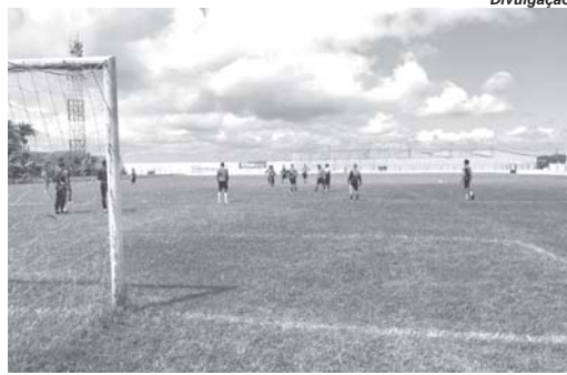
Falcão Negro treina em preparação para a disputa do Regional da Liga Serranense

O Operário Esporte Clube está de volta às competições depois de dois anos, após a pandemia da covid-19 que praticamente paralisou o mundo. Há cerca de 20 dias a equipe se prepara para a disputa da fase regional da Copa do Estado de São Paulo, pela Liga Serranense, promovida pela Federação Paulista de Futebol.