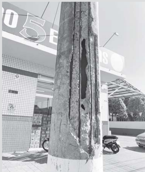
Atenção Cemig, este poste que serve para instalação e condução de energia elétrica, telefonia e internet, está se esfarelando e se inclinando