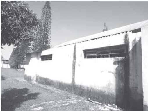
CSU 1, ala esportiva em precária conservação, piscina virou possível foco de Dengue, roubaram os holofotes que iluminavam a quadra coberta e roubaram também o telhado dos sanitários da quadra coberta