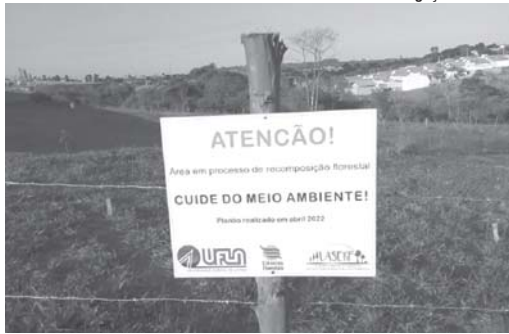
Iniciativa pretende avaliar comportamento das mudas plantadas e o seu desenvolvimento