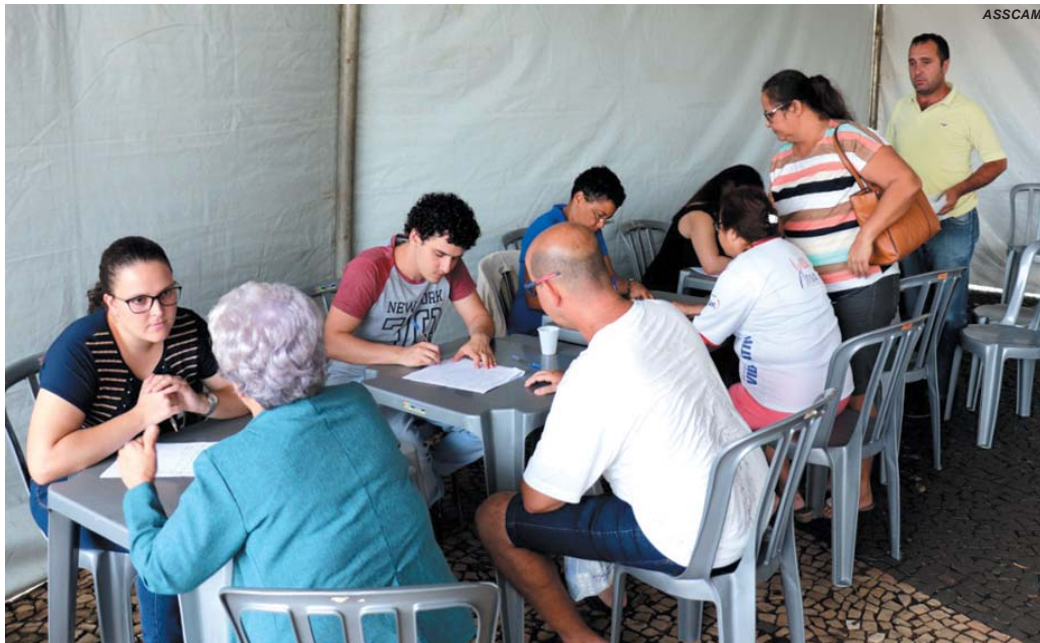
Vereadores e servidores ouvirão reivindicações de moradores aproximando a Câmara da população