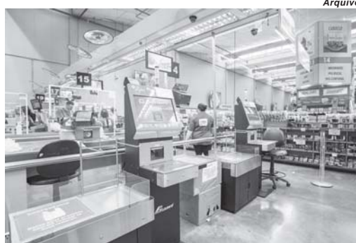
Self Checkout loja Castelo Branco em Ribeirão Preto/SP