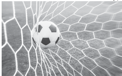
Duas partidas serão realizadas no dia 30 de maio para definir os finalistas da competição