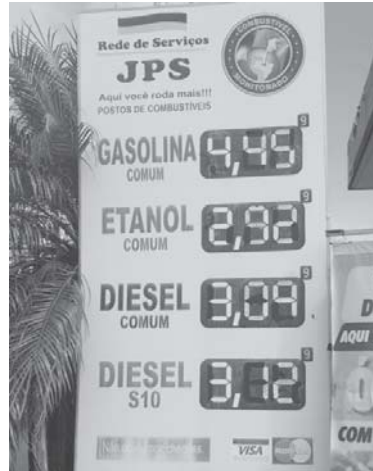
Posto JPS no São Judas Tadeu, preços dos combustíveis na sexta-feira (3/4)

Nesta semana um consumidor paraense que trabalha no ramo de vendas, passando pela cidade paulista de Sumaré, abasteceu o seu carro flex pagando pelo litro do etanol R$ 2,599 e pelo litro de gasolina R$3,899. O litro do óleo diesel no referido posto custa R$ 2,999, conforme consta na placa de valores de preços em anexo a está matéria. O endereço deste posto é na Av. Emílio Bosco 2500 - lote 02, Bairro Nova Rezende, Sumaré SP.