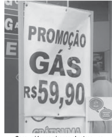
Consumidor paraense abasteceu na cidade paulista, Sumaré, seu carro flex. Veja o valor que ele pagou.