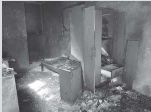
Tiel/Jornal do Sudoeste

Na madrugada desta quinta-feira (2/4), o Corpo de Bombeiros em São Sebastião do Paraíso atendeu duas ocorrências relativas a incêndio, a primeira no bairro João XXIII por volta das 00h30 e a segunda, por volta das 06h30, no Jardim Europa. O primeiro caso, conforme o CB, foi em residência onde estavam dois homens, no João XXIII. Ao chegar ao local as chamas já haviam sido controladas por populares, entretanto, uma das vítimas, de 53 anos, havia sofrido queimaduras de segundo grau em 90% do corpo. As vítimas foram amparadas pelos bombeiros e encaminhadas para a Santa Casa.