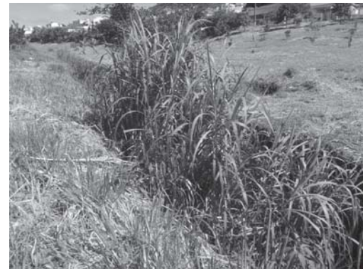
Mato que está dentro do leito da canalização do Córrego Coolapa, é inconcebível