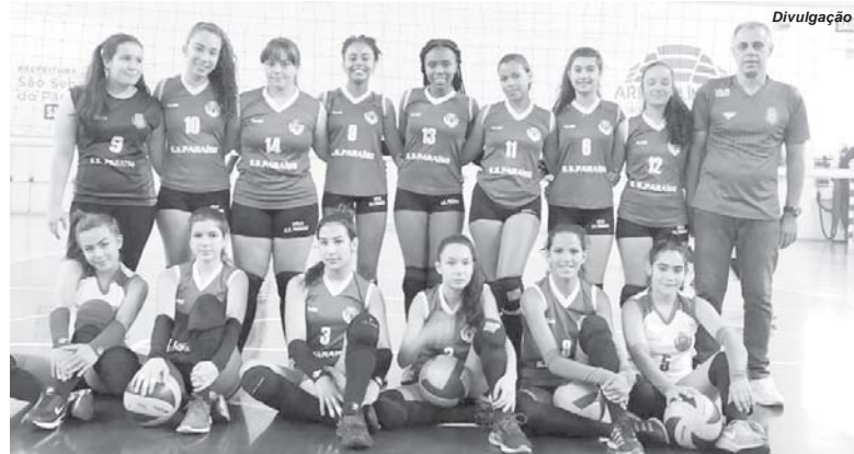
Time formado por jovens atletas realiza campanha de destaque na competição