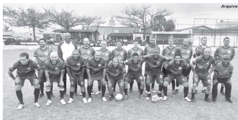
Ipiranga em busca de reabilitação venceu a primeira partida no campeonato

O TNB tem nove pontos ganhos e está com a liderança absoluta da competição. Em seguida está a Associação Atlé-