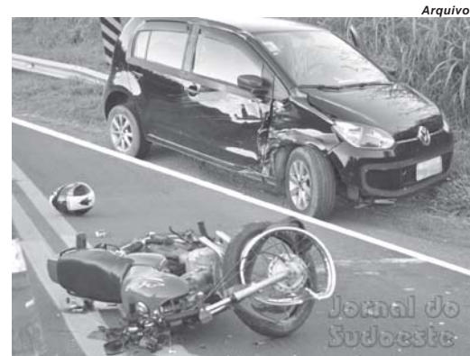
Campanha alerta sobre as atitudes dos envolvidos no trânsito onde todos devem ser responsáveis pela preservação da vida

Em Paraíso durante a Semana do Trânsito foram programadas várias ações e eventos que vão envolver a comunidade. Serão desenvolvidas atividades de educação e conscientização para a segurança nas vias. Entre as medidas programadas consta a fixação de banners na cidade, realização de passeio ciclístico e blitzes educativas com personagens