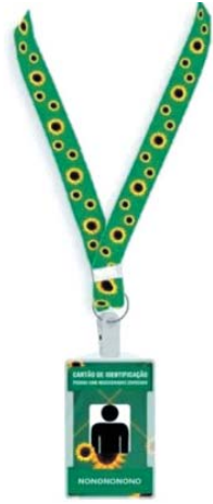
Projeto sobre uso do cordão de girassol começa a ser debatido na Câmara de Paraíso

Segundo o autor o objetivo garantir o atendimento prioritário, no momento da abordagem para deficiências que não são visíveis. “Considera-se com deficiência oculta, aquela deficiência ou condição neurológica que não é identificada de maneira imediata, por não ser fisicamente evidente”, justifica. Entre as áreas de abrangência encontra-se o Transtorno do