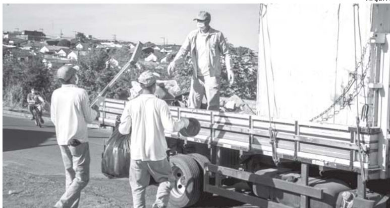
Com aprovação do projeto Paraíso ampliará número de agentes em atuação no município