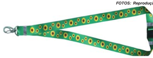
Cordão de girassol pode ser acompanhado de crachá de identificação

Espectro Autista (TEA), Transtorno de Déficit de Atenção e Hiperatividade (TDAH), transtornos ligados à demência, Doença de Crohn, colite ulcerosa e fobias extremas.