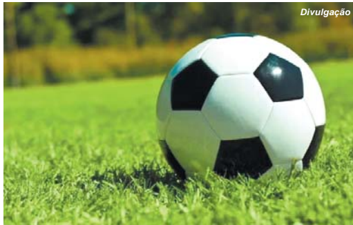
Construções de campos de futebol beneficiarão três diferentes regiões da cidade