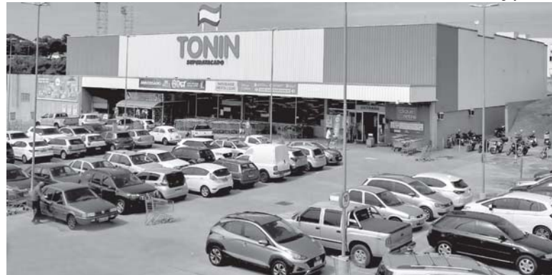
Rede Tonin é um dos maiores grupos do ramo de atacarejo do interior de São Paulo e Sudoeste de Minas Gerais

De acordo com ela, foram feitas adaptações dos sistemas