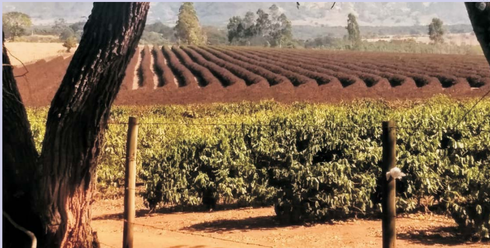
Lavoura de café na divisa entre os municípios de São Sebastião do Paraíso e Santo Antônio da Alegria (SP), ficou queimada ao ser atingida por recente geada.

A exemplo de Santa Paula, os jovens deixam recados de fé e esperança!