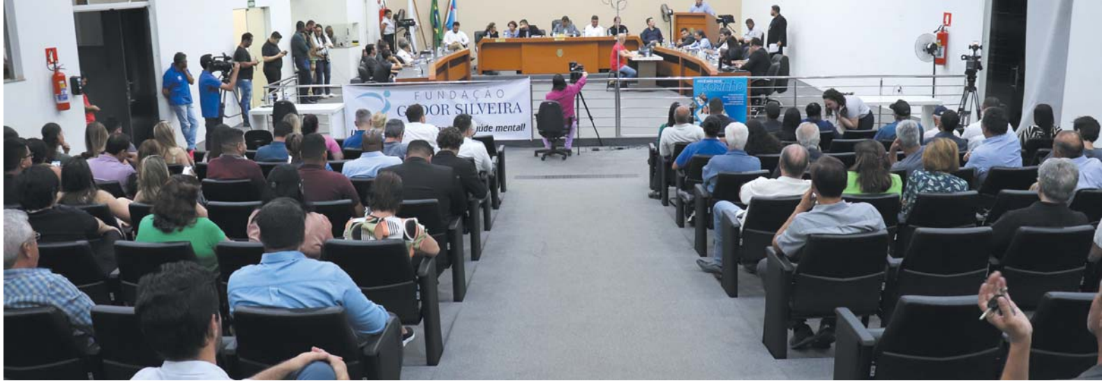
Audiência pública reuniu políticos, autoridades, populares e funcionários com um único objetivo: evitar que o hospital feche suas portas

Rede de esgoto estourada, moradores pedem providências à Copasa