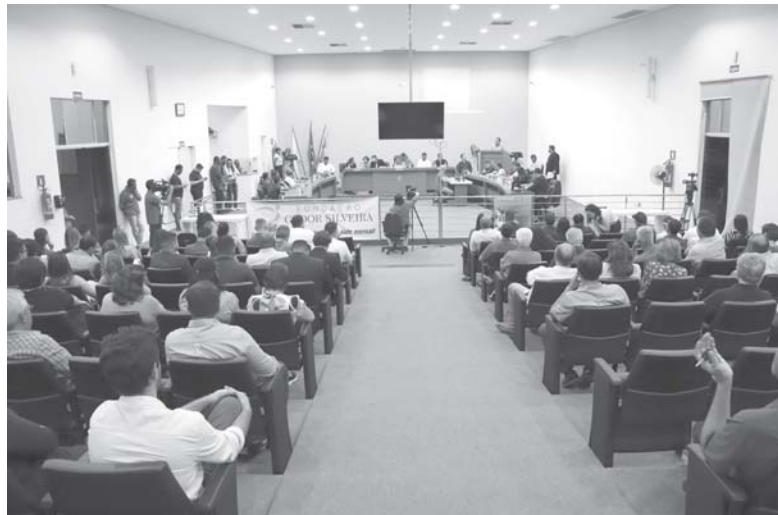
Por Ralph Diniz

Audiência pública reuniu políticos, autoridades, populares e funcionários com um único objetivo: evitar que o hospital feche suas portas