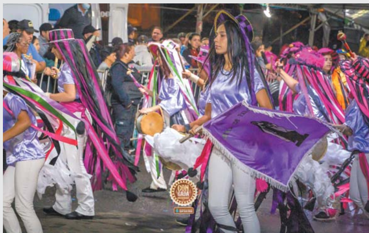
Terno de Congo As Filhas de Paraíso