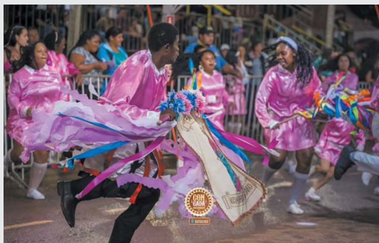
Terno de Moçambique Nossa Senhora do Rosário