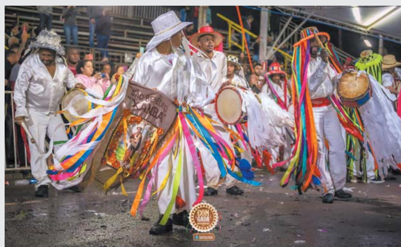
Terno de Congo Xambá