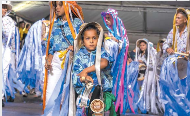
Terno de Congo Anjos de São Benedito