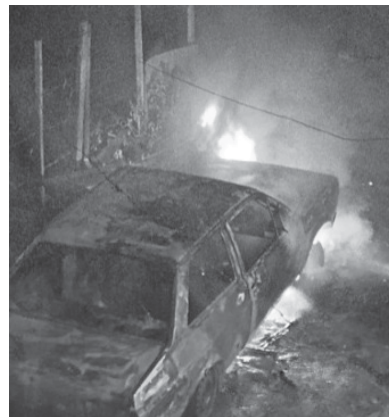
Veículo ficou totalmente destruído após ser consumido por incêndio no bairro São Judas

Outro incêndio combatido pelos Bombeiros ocorreu ain-