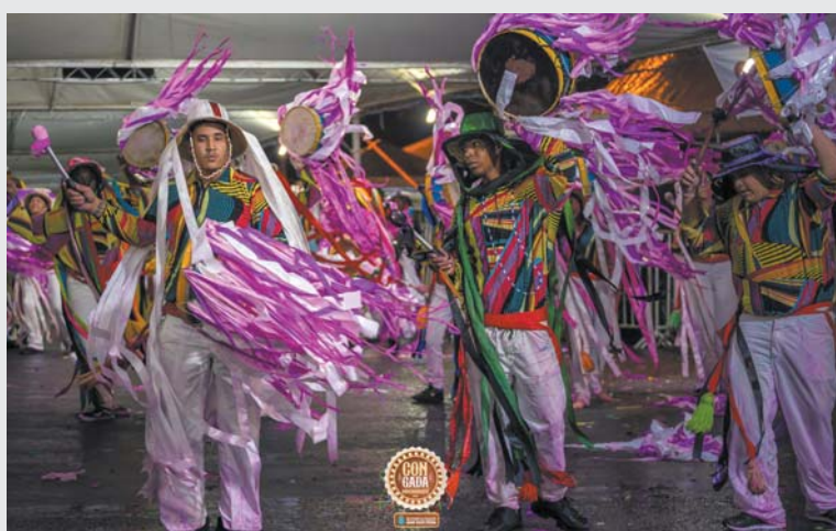
Terno de Congo Canários Paraisenses