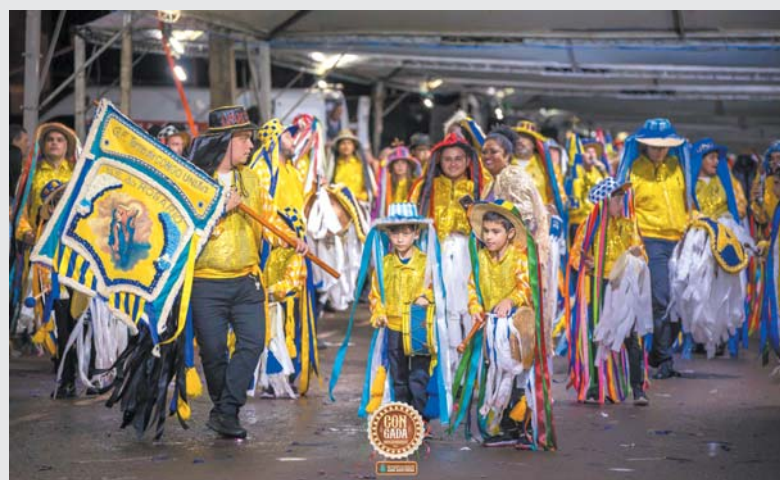
Terno de Congo União