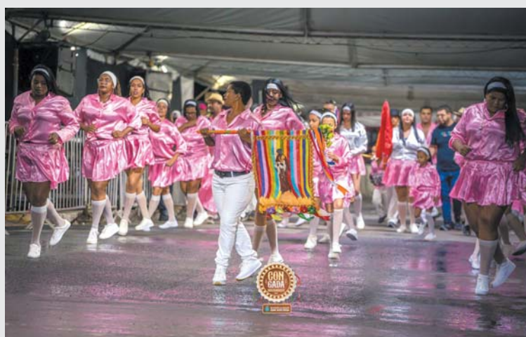
Terno de Moçambique Santos Dumont