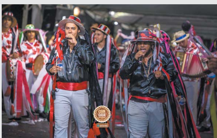
Terno de Congo Novo Milenio