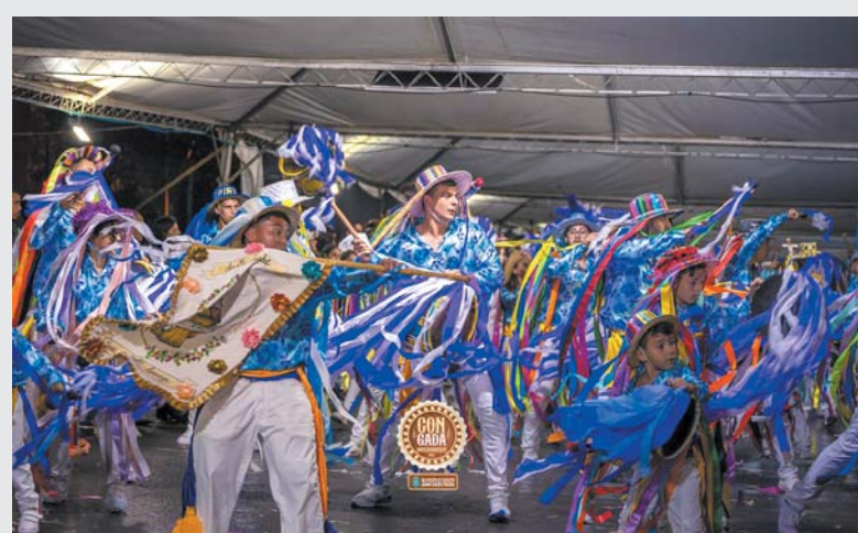
Terno de Congo Ipiranga