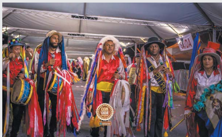
Terno de Congo Sabiá