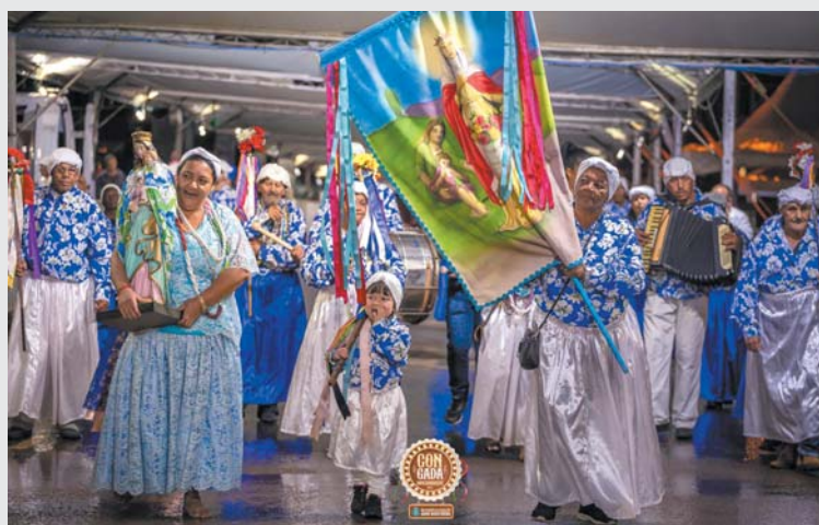
Terno de Moçambique Santa Isabel