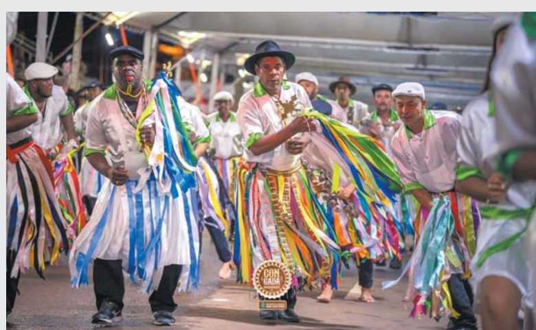
Terno de Moçambique Diamante