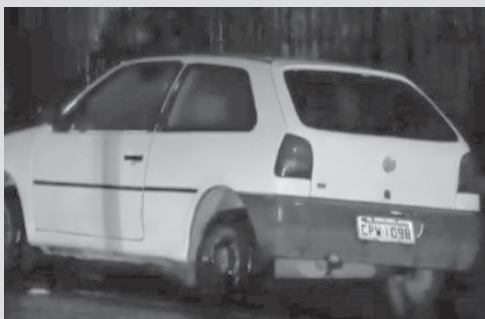
PM fez a recuperação do Gol próximo a um ponto de tráfico na zona sul de Franca (SP)

A Polícia Militar em Franca (SP) anunciou ter recuperado um veículo Gol, branco, com placas de São Sebastião do Paraíso, que apresentava queixa de furto. A ação foi motivada por uma denúncia anônima de ocorrência de tráfico de drogas na Vila Gosuen, quando o automóvel foi localizado. Os suspeitos de estarem com o veículo fugiram ao perceberem a aproximação da viatura, mas uma menor acabou sendo apreendida e tinha com ela no bolso da calça a chave do carro.