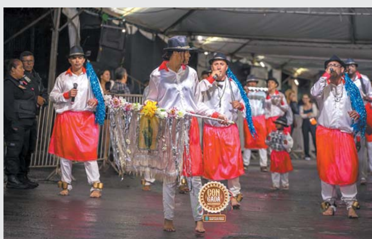
Terno de Moçambique Zambê de Angola