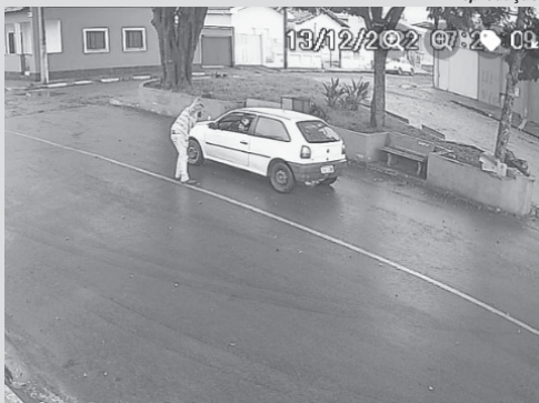
Veículo foi visto após o furto na Vila Nova em São Tomás de Aquino