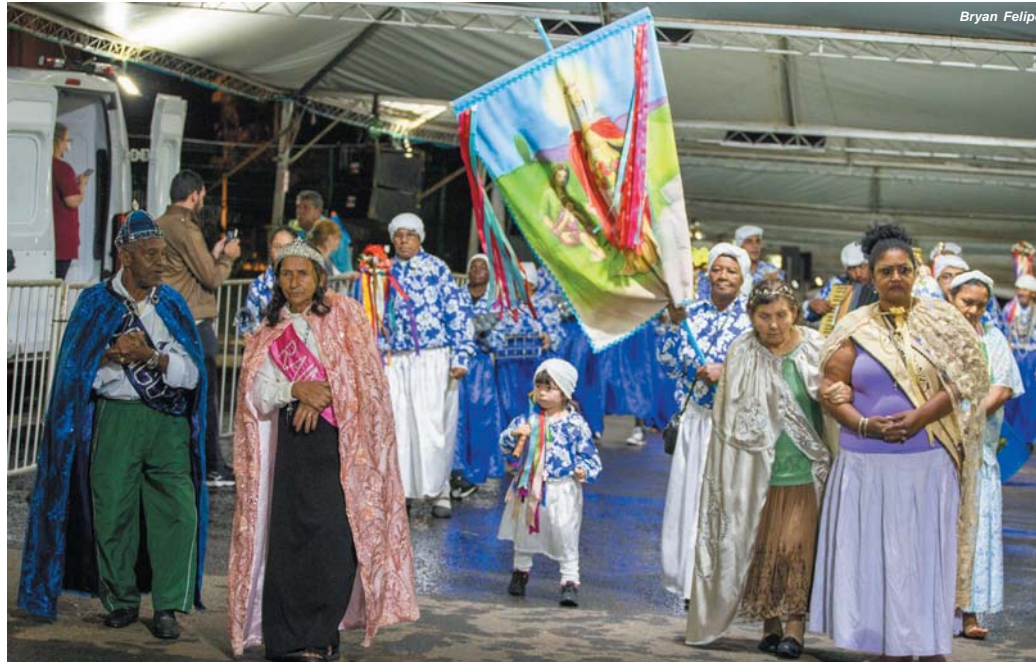
Reisado da Congada 2022