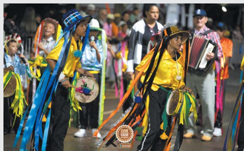
Terno de Congo Nova Geração