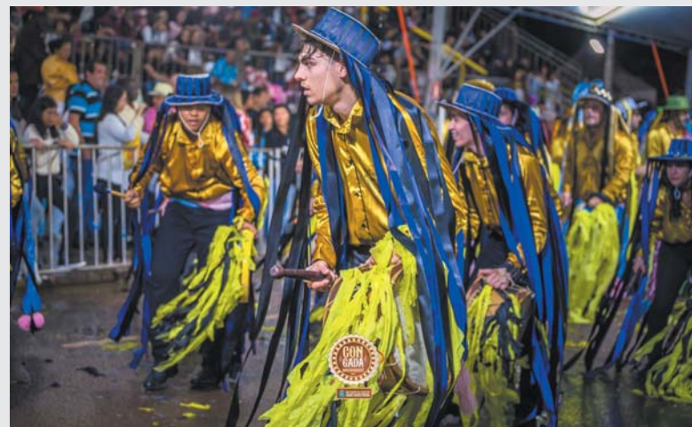
Terno de Congo Bela Vista