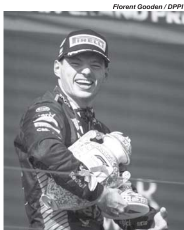
Max Verstappen sorridente após vitória esmagadora na Hungria

Sim, eles estão 'irritantes' no bom sentido da palavra, e só não estão mais porque Perez atravessou uma má fase em que ficou cinco vezes seguidas fora do Q3, o terceiro bloco da classificação, mas no domingo passado foi ou-