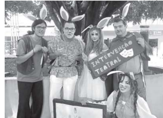
Grupo ficou conhecido pelo público pelas intervenções teatrais realizadas na praça da Matriz

O Grupo Deveras Artes é conhecido na cidade pelas suas intervenções teatrais na praça Comendador José