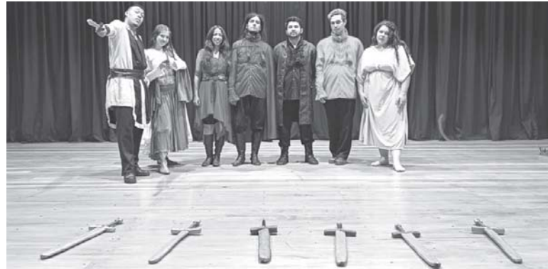
Elenco do Grupo Teatral Deveras Artes se apresentará no Teatro da Acissp neste sábado, a partir das 20 horas