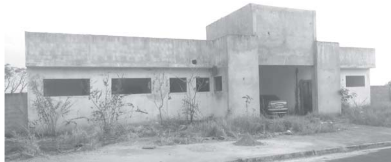
Moradores no Bairro Rosentina 2, pedem o término da obra da UBS, que está inacabada e abandonada

Infelizmente somente a obra da UBS no Rosentina 2, não foi concluída. Por este motivo moradores do Rosentina 2, procuraram o JS para pedir ao prefeito Marcelo de Moraes para que conclua aquela obra, de vez que a UBS é de fundamental importância para o atendimento da saúde dos moradores dos Bairros Rosentina, Rosentina 2, Paraíso do