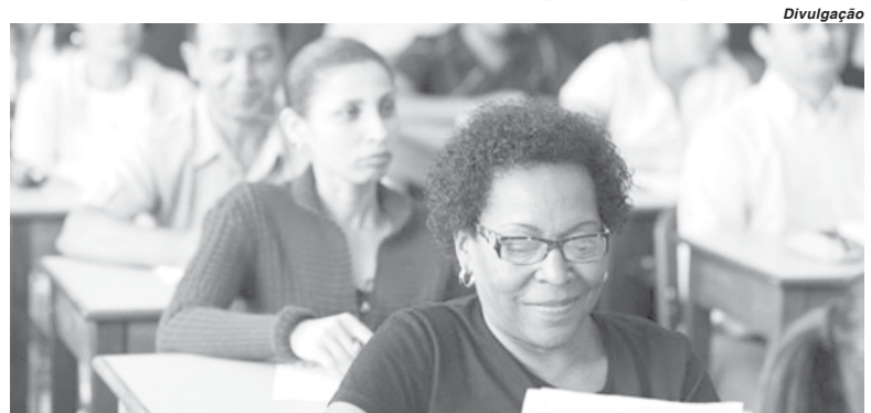
Interessados devem entrar em contato com uma das unidades de ensino que oferecem a modalidade

Em São Sebastião do Paraíso a oportunidade é oferecida pelas escolas estaduais Comendadora Ana Cândido de Figueiredo, Benedito Ferreira Calafiori e na E.M. Campos do Amaral. Na região atendida pela 35ª Superintendência Regional de Ensino, a atividade