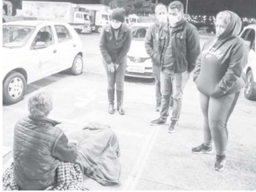
Algumas pessoas não aceitaram ir para abrigos, mas receberam cobertores para se proteger