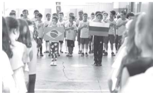
Crianças também se envolvem com projeto educacional sobre a copa

À medida que os jogos da Copa do Mundo de Futebol vão sendo realizados e mesmo o Brasil não fazendo uma campanha de fechar os olhos, aos poucos os torcedores paraisenses vão aderindo cada vez mais aos jogos. O assunto já é um dos temas mais comentados nas ruas, nos comércios e nas rodinhas entre as pessoas. Também nas escolas um trabalho desenvolvido na Escola Municipal Noraldino Lima tem movimentado a criançada.