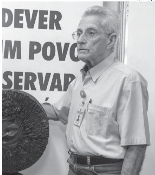
Corpo do paraense foi cremado em Maringá cidade onde ele viveu maior parte de sua vida

brasão e da bandeira do município de Maringá.