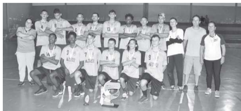
Garotos de Varginha foram campeões ao derrotarem Paraíso na decisão