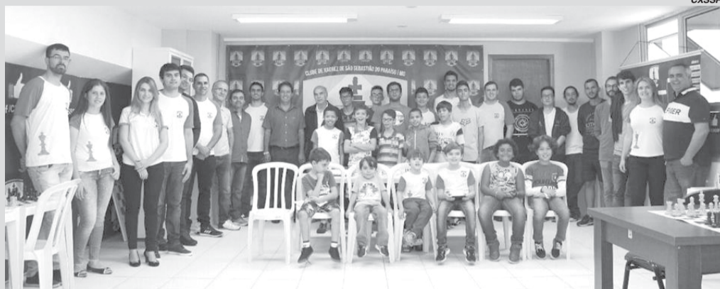
Foto histórica do xadrez paraense, reunindo várias gerações

Para comemorar 1 ano de nova sede, o Clube de Xadrez de São Sebastião do Paraíso (CXSSP) realizou um evento comemorativo com direito até a bolo personalizado!