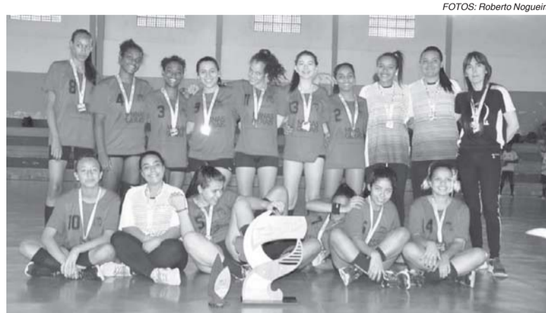
Equipe feminina de Muzambinho venceu Paraíso na final e sagrou-se campeã

As duas partidas que encerraram o torneio também foram marcadas por muita disposição e dedicação dos atletas em quadra. Como neste tipo de competição só pode ter um vencedor, prevaleceu o time que foi mais feliz em quadra, com melhor aproveitamento das jogadas. No final uma grande confraternização entre os jogadores, treinadoras, confirmando que o esporte ainda é uma das melhores opções para uma juventude sadia e de futuro promissor para quem se dedica no que faz.