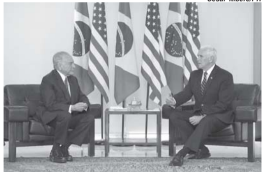
Governo brasileiro vai colaborar no transporte dos brasileiros, disse Temer

Brasil e Estados Unidos da América trabalham juntos para reunir as crianças brasileiras que foram detidas e separadas dos pais ao tentar entrar em território norte-americano de forma ilegal. Em comunicado realizado nesta terça-feira (26), o presidente da República, Michel Temer, apontou a necessidade de resolução para o caso rapidamente.