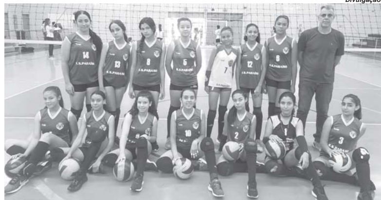
Com mais uma boa apresentação meninas do vôlei de Paraíso classificaram para a final da Copa dos Campeões

A partir destes jogos, as duas equipes mais bem pontuadas irão disputar a final. São