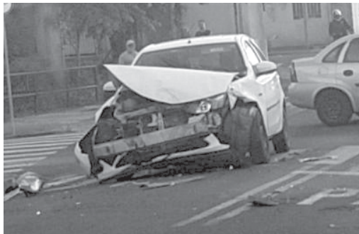
Colisão entre veículos foi registrado na Avenida Joaquim Ferreira Guimarães