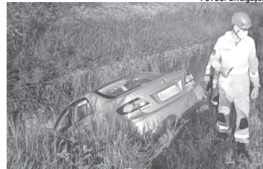
Corolla sem freios caiu córrego carrapatinhos, altura do Parque Andorinhas

Três acidentes de trânsito foram registrados durante o final de semana em São Sebastião do Paraíso. Em nenhuma das ocorrências houve feridos graves e os casos resultaram em danos materiais aos envolvidos.