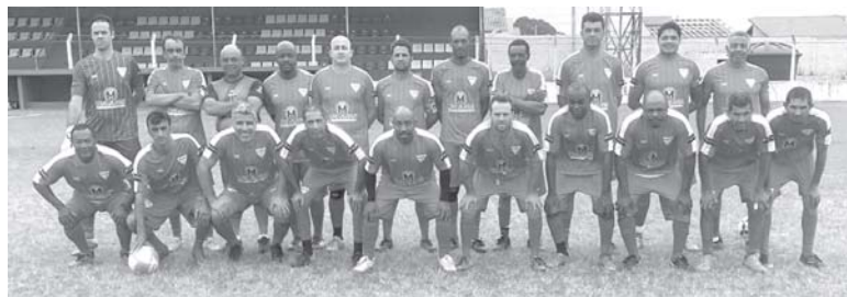
Clube Veteranos Aquinense

final da partida a comemoração foi geral entre os visitantes.