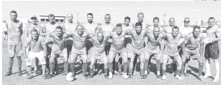
Associação Atlética Paraisense

O jogo foi equilibrado na primeira etapa com ambos os times se respeitando e promovendo mais o jogo defensivo. Contudo, na etapa final e com a necessidade de definir o placar, as equipes buscaram mais o resultado. Com um jogador a mais em campo os aquinenses abriram o marcador e sustentaram o marcador mesmo tendo o goleiro titular expulso. Ao