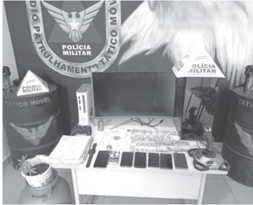
Caso teve início com a apreensão de vários objetos ligados a furto, tráfico e resultou na prisão do jovem que faleceu na cadeia

Uma sindicância deverá ser instaurada a partir desta segunda-feira, 7, pelo Departamento Penitenciário de Minas Gerais (Depen-MG) para apurar as circunstâncias da morte de um interno do presídio de São Sebastião do Paraíso. O corpo do jovem de 20 anos foi encontrado sem vida no amanhecer de domingo, três dias após ele ter sido preso. Durante abordagem, na tentativa de fuga ele entrou em uma propriedade e foi atacado por um cão pitbull, que lhe provocou diversos ferimentos pelo corpo.