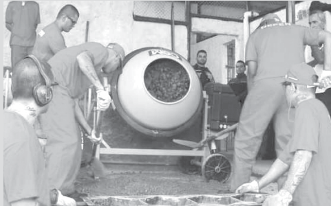
Detentos do Presídio de Congonhas vão produzir mais de dois mil pequenos blocos de cimento por dia

A mão de obra de 16 detentos do Presídio de Congonhas, na região Central do estado, vai contribuir para a melhoria da infraestrutura das áreas urbana e rural do município. Nesta segunda-feira (7/11), foi inaugurada uma fábrica de bloquetes sextavados (pequenos blocos com seis lados) de cimento dentro da unidade prisional. Toda a produção será direcionada para o calçamento de ruas de Congonhas, com meta de produção de duas mil peças por dia.