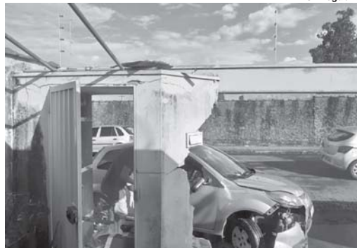
Residência teve portão e muro atingidos no bairro Rosentina de Figueiredo

Já na tarde do domingo, 6, moradores de uma residência na Rua Professor Corrêa Pinto, no bairro Rosentina de Figueiredo, se assustaram depois que um veículo desovernado atingiu o portão e o muro da casa. Segundo o mo-