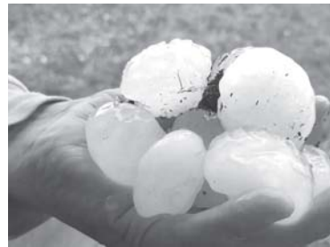
Chuva em Alterosa/MG