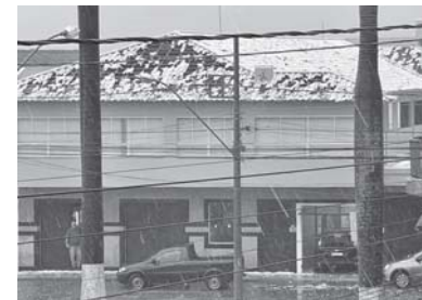
Chuva em Campos Gerais/MG