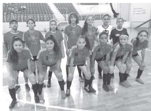
Equipes das categorias de base do futsal feminino de Paraíso conquistam bons resultados

Em seguida, na categoria Sub-17, Paraíso venceu por 2 e 0 contra Casa Branca. Já na disputa contra São José do Rio Pardo, a vitória veio e por goleada sendo 4 a 0. Na categoria Sub-15, outra vitória impor-