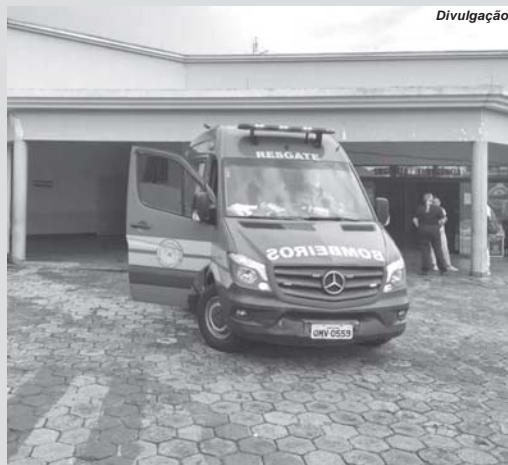
Resgate dos Bombeiros encaminhou vítima atropelada para a Santa Casa

O Corpo de Bombeiros foi acionado por uma das pessoas que fazia a travessia na via. A solicitante narrou que ela, seu filho e a vítima atingida, que é sua irmã, transitavam no centro da cidade. Disse que tentaram atravessar sem observar o semáforo para pedestres, quando ocorreu o atropelamento.