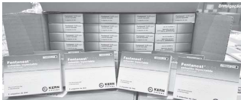
O monitoramento dos estoques de kits intubação é feito semanalmente nos hospitais

Para a região, foram enviados 4.563,6 medicamentos. Além de Paraíso, os hospitais de municípios como Alfenas,