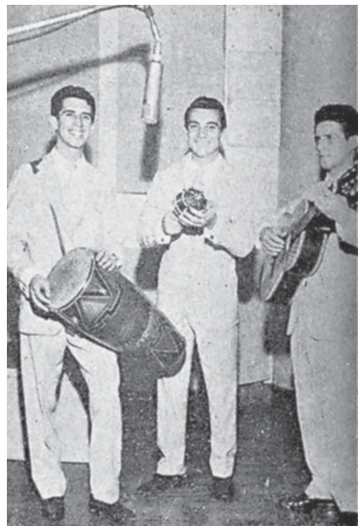
O "Trio Montanhês estreou, na RGE

Nos anos seguintes, o Trio Montanhês fez várias apresentações em programas de televisão, tais como aqueles animados por Silvio Santos e Hebe Camargo. A trajetória de sucesso dos cantores está registrada em diferentes crônicas publicadas em jornais de ampla circulação nacional. Finalmente, depois de 60 anos, ficou na história a produção dos três jovens cantores afinados, cujas vozes vibraram nas paradas de sucesso das grandes emissoras do país e ainda ecoam no coração de todos aqueles que acreditam do poder da cultura como instância de aproximação das pessoas.