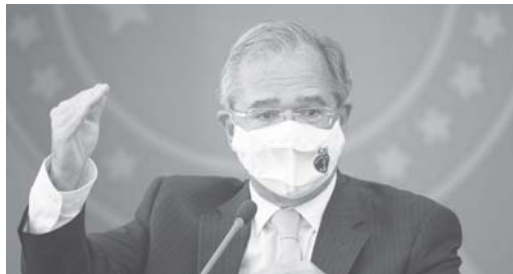
Por Luciano Nascimento - Repórter da Agência Brasil - Brasília

Ministro da Economia falou em audiência pública na CCJ da Câmara