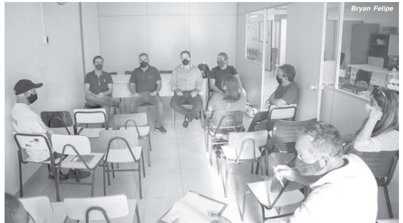
A previsão é que sejam entregues, em média, 600 cestas por mês até outubro

Também foi levantado quais produtores já tem alimentos para serem ofertados ao Programa na terça-feira, dia 18. Em geral, são entregues hortaliças, frutas e legumes e o dinheiro pago a quem participa do P.A.A. é um complemento da renda ao produtor. A previ-