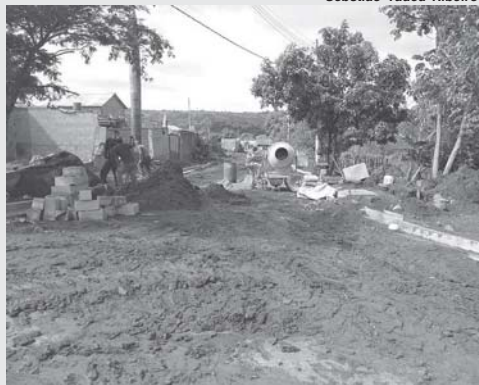
Na rua Basilícia Maria de Oliveira no Jardim das Acácias, está quase concluída a construção de uma boca de lobo para iniciar a pavimentação asfáltica