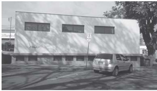
Sanitário público municipal já está funcionando nos horários das 7:00 às 18:00 horas, em todos os dias da semana do ano inteiro