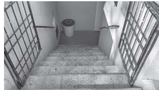
Escadarias para acessar o sanitário Público Municipal dificulta a acessibilidade de pessoas com problemas físico de locomoção

Uma feliz iniciativa que será bem recebida pela população paraense e visitantes. Merece nota oito. Irá alcançar nota dez quando o prefeito determinar modificações de modo fa-