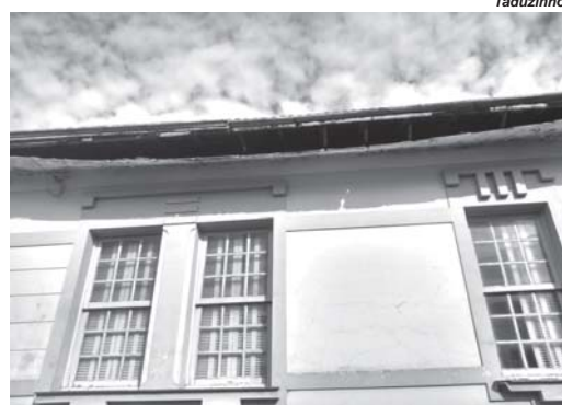
Estuque de beiral está se desprendendo e a oferecer risco de acidentes

Acontece que nesta antiga casa residencial o estuque do beiral está se desprendendo e prestes a cair a qualquer momento sobre a calçada, podendo sim provocar acidentes com pedestres. Esta referida casa não tem afastamento nenhum da