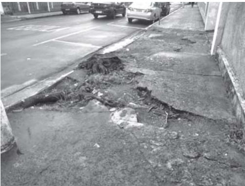
Av. Mons. Mancini, Vila Dalva, calçada com enorme buraco e na rua José Honório dos Santos, no Loteamento Alto Bela Vista, até chassis de caminhão tem em cima da calçada