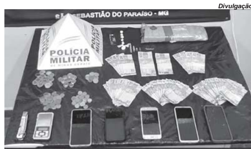
Tablete de um quilo de maconha e outras drogas foram apreendidos pelo Tático Móvel na noite de terça-feira, 5

Durante a abordagem aos indivíduos, os policiais perceberam que uma mulher, de 30 anos, correu para o interior da residência sendo que, no meio