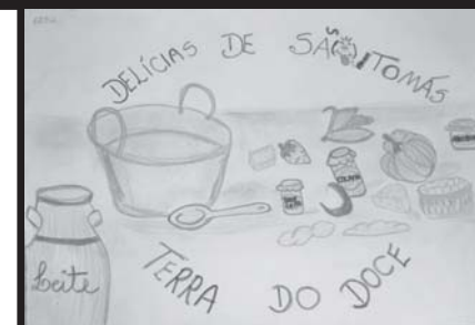
Logotipo 3º Lugar