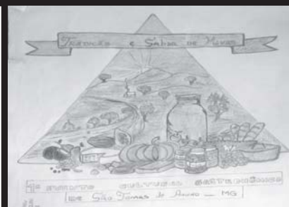
Logotipo 2º Lugar