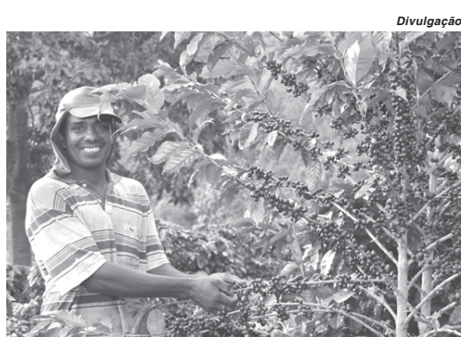
Encontro para cafeicultores de Jacuí e região será na próxima quinta-feira dia 10 de maio