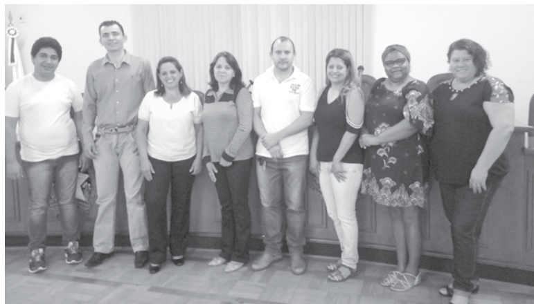
Participantes do Projeto Festa Doces e Delícias de São Tomás de Aquino

Na história de São Tomás de Aquino tem destaque como tradição do município a arte artesanal dos doces caseiros, quitandas e queijos. Quitutes esses, orgulho para oferecer aos visitantes, aos amigos e enviar para parentes distantes que não moram mais em São Tomás. Oferecer uma cesta destes produtos, como presente, eleva o nome da cidade e tem o significado de quem presenteia, de carinho e amizade, para quem recebe.