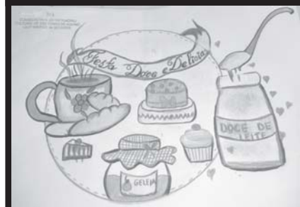
Logotipo 1º Lugar