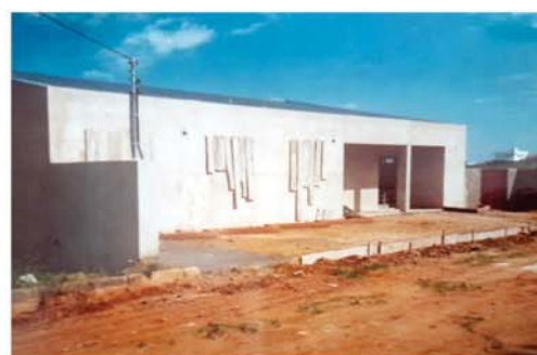
Sede da Acqua Sport em 2024