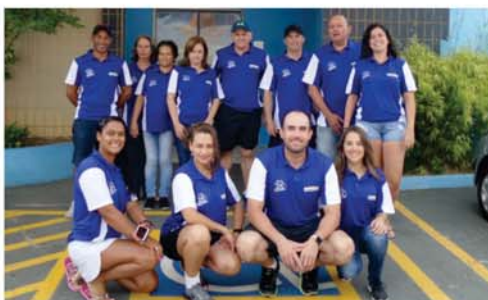
EQUIPE ACQUA SPORT EM 2019

Muito Obrigado a meus Pais e minha família! Que continuem este trabalho iniciado há 30 anos, e gratidão a minha cidade, São Sebastião do Paraíso, por abraçar nossa Acqua Sport .