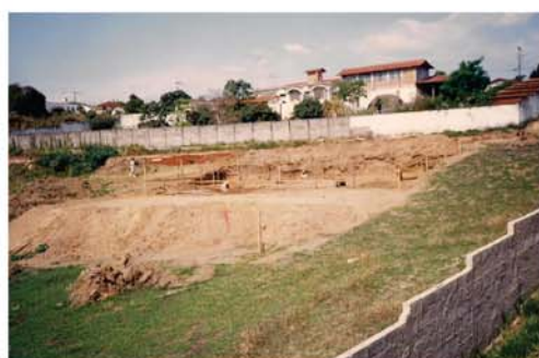
Início da construção em 22 de setembro de 1992