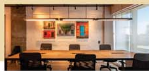
COWORKING: Estações de trabalho compartilhado coletivo e privado