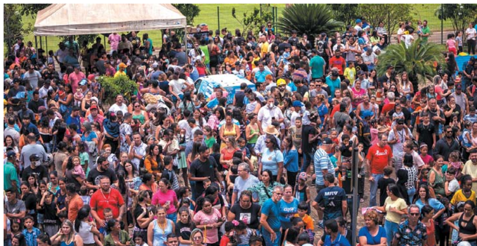
Por Motociclismo Solidário Brasil

A décima edição do Natal MotoSolidário 2022, foi um verdadeiro sucesso, superando todas as expectativas dos organizadores com a participação em peso da população. Tivemos o importante apoio da Prefeitura de São Sebastião do Paraíso e do Batalhão de Bombeiro Militar de Minas Gerais.