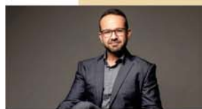
MENTORIA MMPE Método Marcelo de Pádua de Empreender