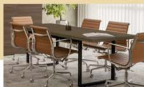
Salas de reuniões