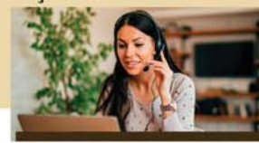
ESCRITÓRIO VIRTUAL: Suporte ao empreendedor