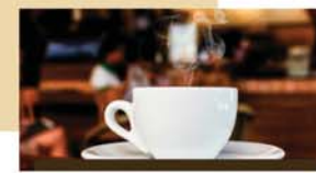
CAFETERIA: Diversas opções deliciosas