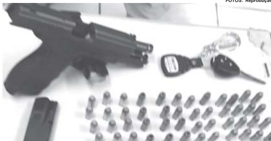
Possível arma do crime uma pistola com várias munições foi apreendida com uma mulher