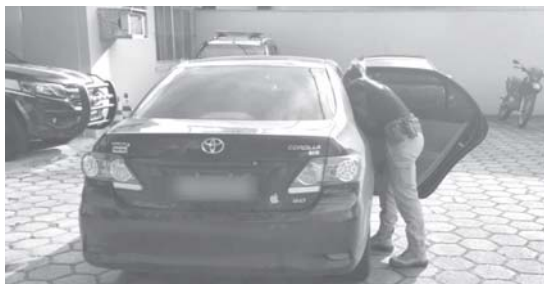
Carro utilizado na fuga foi parado em blitz em Teófilo Otoni