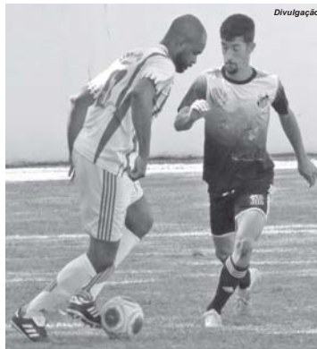
Atlético de Cravinhos supera o Operário e fará decisão do regional contra São José

O Operário fez uma campanha regular com apenas três