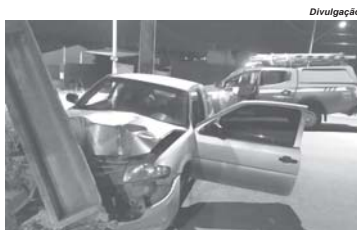
Duas das ocorrências atendidas pelos socorristas envolveram motociclistas e um terceiro caso um veículo que atingiu um poste

As portas do veículo não abriam pelas maçanetas externas, sendo o acesso pelo vidro lateral direito que estava aberto. A vítima segundo registros, estava consciente,