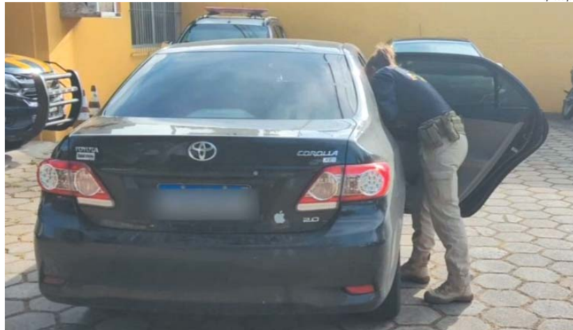
Carro utilizado na fuga foi parado em blitz em Teófilo Otoni, três homens e um mulher foram presos

Sicoob Nossocrédito faz doação de R$ 130 mil ao Hospital Gedor Silveira