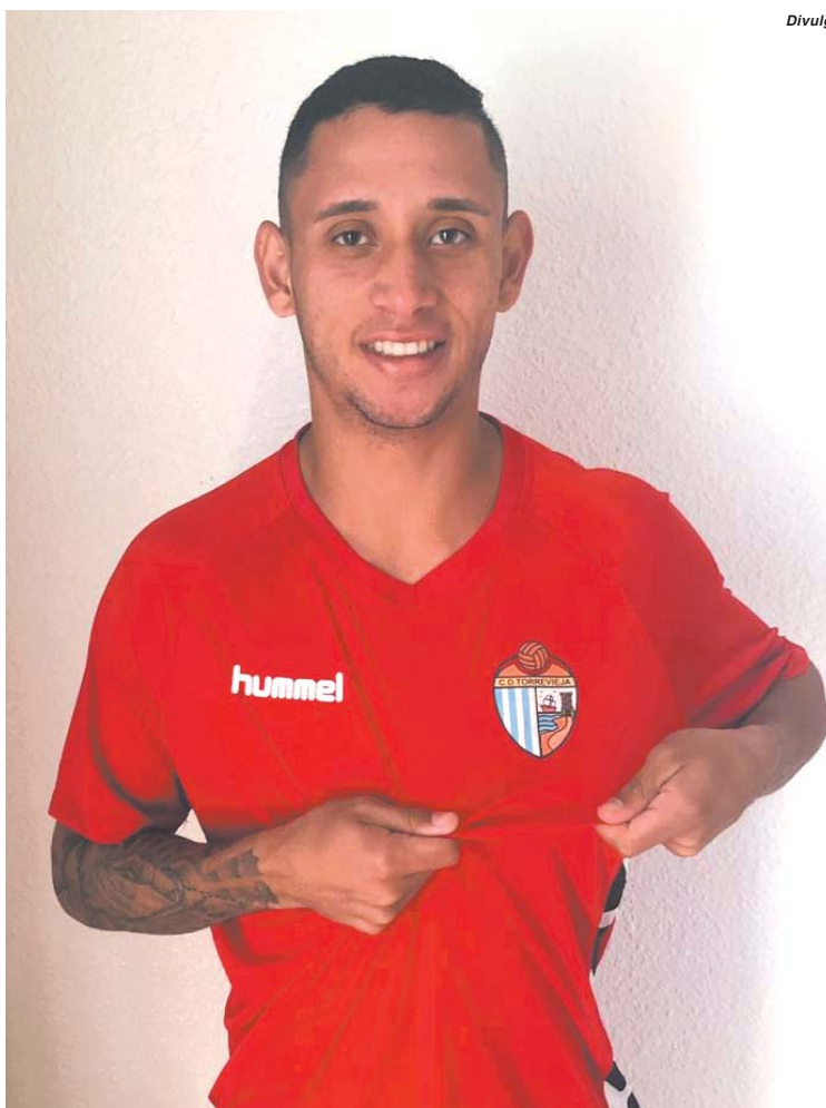
Atacante segue na Europa onde pretende fazer carreira como jogador de futebol

O jogador está hospedado no hotel da equipe na cidade litorânea e turística de Torrevieja. Nestes primeiros dias ele está com agenda livre para se adaptar à cidade e exercitar o espanhol, mas na segunda-feira iniciam-se os treinamentos. "Estou bastante feliz com esta oportunidade que vou agarrar com