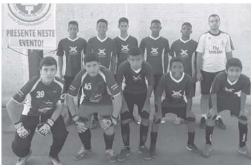
Equipe Sub 15