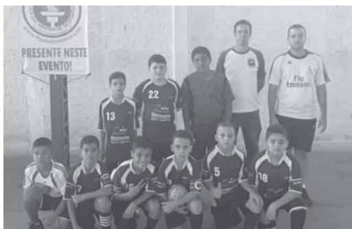
Equipe Sub 11

No sábado (1/9) aconteceu na quadra Marcos Ângelo de Oliveira, da COHAB, a 5ª Rodada de Futsal da Liga Sul Mineira de Desportos. Participaram equipes da região: São José da Barra, Itaú de Minas, Itamogi, Fortaleza de Minas, Alpinópolis e São Tomás de Aquino.