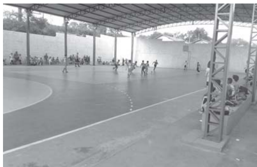
Quadra da COHAB