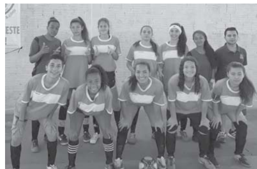
Equipe Feminina Sub 17