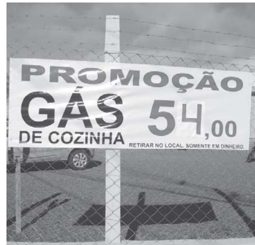
No revendedor Alemão Gás o preço é R$ 54,00 no local de venda e R$ 58,00 para entregar