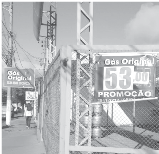
No estabelecimento Comercial Gás Original está vendendo por R$ 53,00 no local de venda e R$ 65,00 para entregar

Vamos aguardar as próximas atitudes e determinações do "comando do gás" sobre o preço do gás em São Sebastião do Paraíso. Vale lembrar que o botijão de 13 quilos vendido por R$ 70, até R$ 80, é até um pecado.