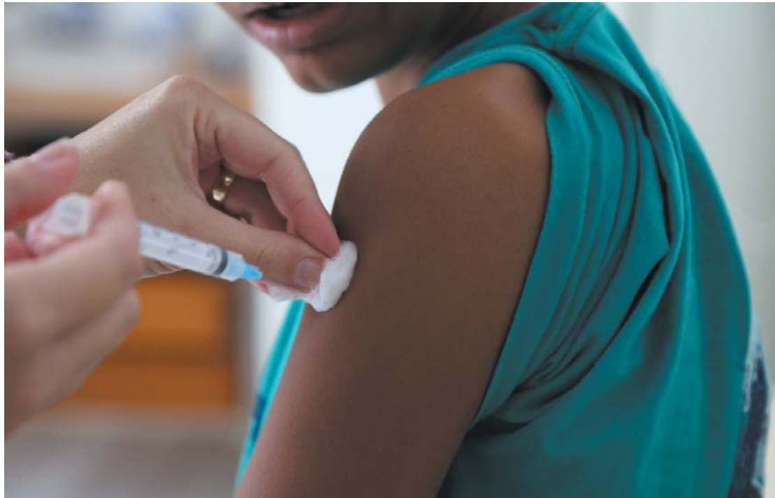
Com o atendimento realizado no último sábado município atingiu a casa de 85% do público alvo a ser vacinado

Em Paraíso, juiz determina indisponibilidade de bens de presidente da Câmara