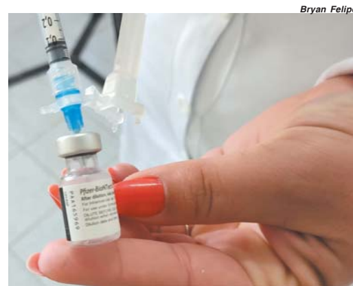
Vacinação atendeu professores e integrantes dos grupos prioritários nas últimas semanas