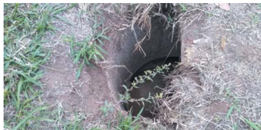
Enorme buraco sem tampa em uma caixa de esgoto que pode provocar acidentes com pessoas e animais, as margens da canalização do Córrego Coolapa, próximo da rua Tabajara Pedroso, no Jardim Coolapa

Neste final de semana o "JS" foi ao local, e registrou em foto. Moradores reclamam e esperam providências da Copasa, Vigilância Sanitária e Prefeitura, para sanar essas inconcebíveis irregularidades que podem sim afetar a saúde e segurança física dos moradores e transeuntes.