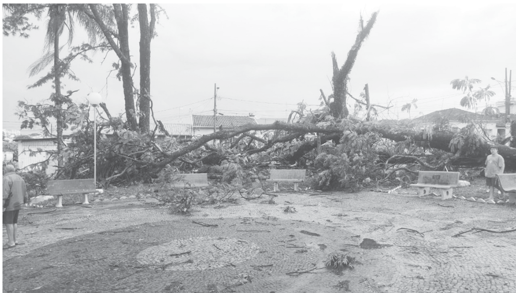
Estragos foram registrados em várias regiões da cidade, com situação mais grave no bairro Nossa Senhora Aparecida