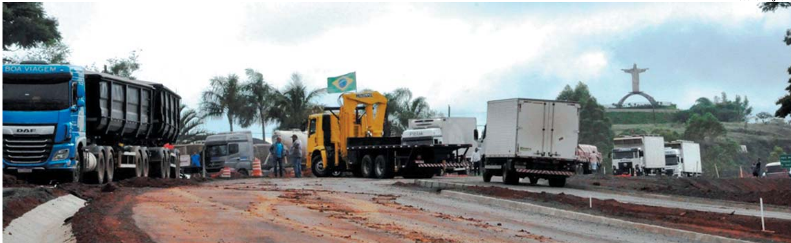
Bloqueio ao trânsito de caminhoneiros foi registrado na MG-050 na entrada de Paraíso, demais veículos podiam prosseguir

Câmara de Paraíso corta pela metade consumo de copos plásticos e lança nova campanha