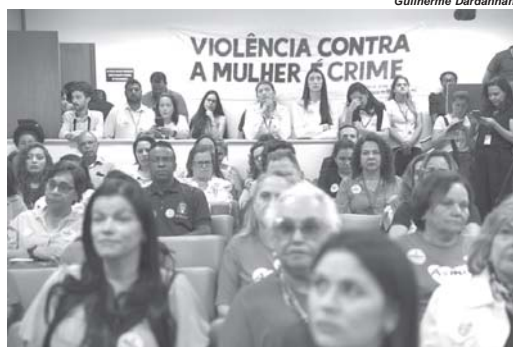
O primeiro encontro debate o tema A mulher e os novos tempos da educação

O segundo encontro com especialistas será na próxima quarta-feira (16), a partir das 14 horas, na ALMG