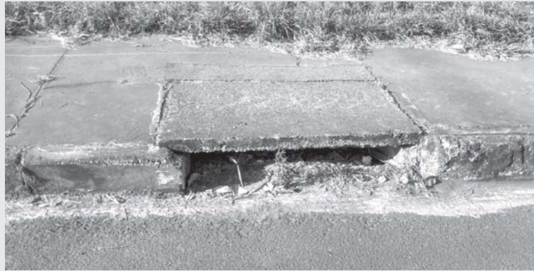
Boca de lobo localizada na rua Tabajara Pedroso bairro Lagoinha, precisa de limpeza

Na rua Tabajara Pedroso, Bairro Lagoinha, no trecho que fica bem no início da canalização com Córrego Coolapa, tem um bueiro que está entupido com detritos. Quando há chuvas volumosas, naquele local desce uma quantidade enorme de enxurrada, e se aquele bueiro e demais logo acima sentido ao prédio da Laticínios Coolapa, estiverem entupidos, a enxurrada desce ainda mais volumosa, e já da-