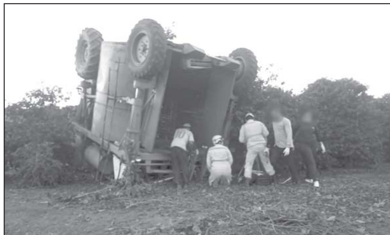
Resgate da vítima foi complexo e trabalhos dos bombeiros perduraram até o início da noite

A máquina, que pesa mais de três toneladas, acabou prensando o homem. Diante do acidente, o 2º Pelotão do Corpo de Bombeiros de São Sebastião do Paraíso foi acionado e uma equipe chegou à