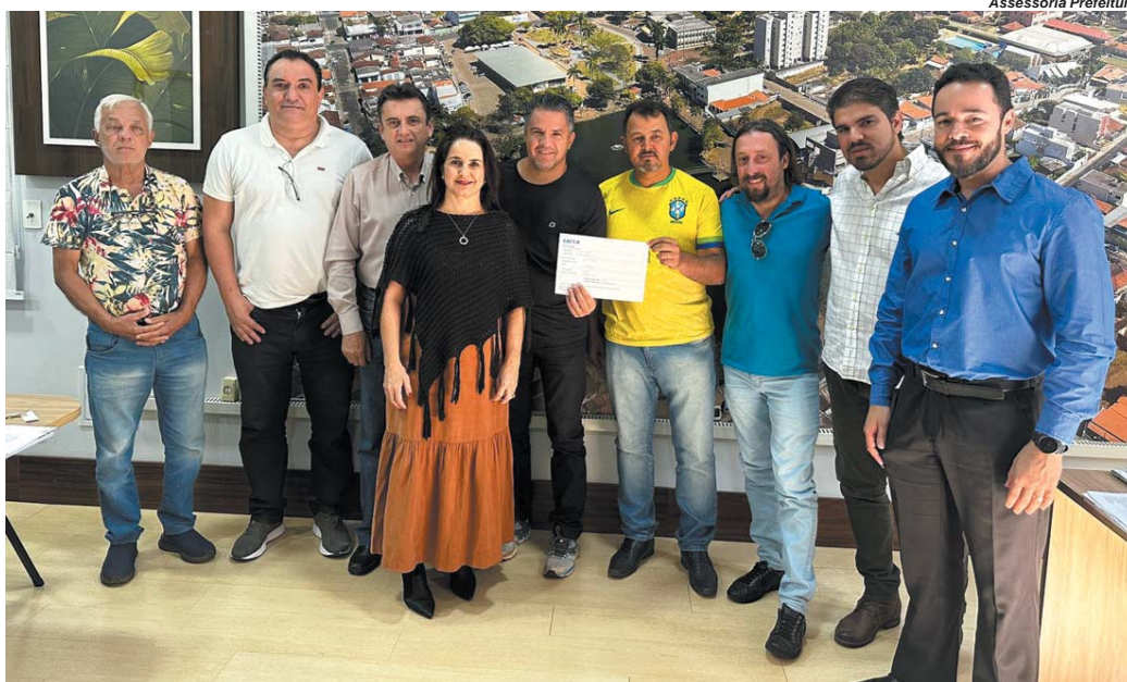
Obras, que devem começar em setembro, serão custeadas com R$ 2 milhões devolvidos pelo Legislativo aos cofres do Município

Qualidade de vida em Paraíso é prejudicada por poluição sonora e insegurança no trânsito