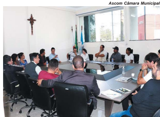
Ascom Câmara Municipal