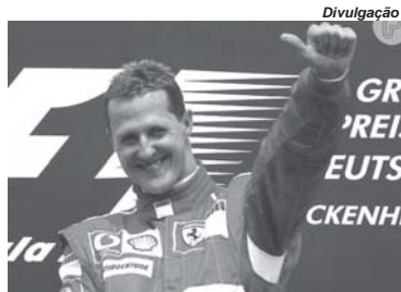
Michael Schumacher, no auge de sua carreira, comemorando mais uma vitória

A última nota oficial divulgada pela família e já tem algum tempo, dizia que o ex-piloto está consciente e se recupera de forma gradativa em sua casa em Lake, na Suíça. Ponto. É tudo que se sabe. Qualquer