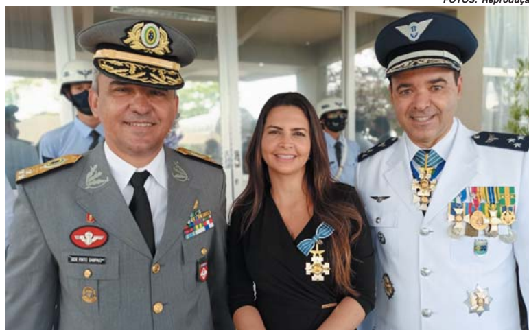
General Pinto Sampaio, Renata Furtado e Brigadeiro Ary Mesquita