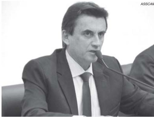
Vereador criticou não atendimento de demandas e afirmou que falta respeito com cidadãos

O vereador lembrou ainda que identificou pelo menos 13 irregularidades no início do trecho da BR-491 com a MG-050 até a divisa do estado de São Paulo na BR-265. "Já anexei as fotos e vou encaminhar à Secretaria de Transporte e Obras Públicas de Minas Gerais (SETOP), para o DEER e Nascentes das Gerais, assim eles se