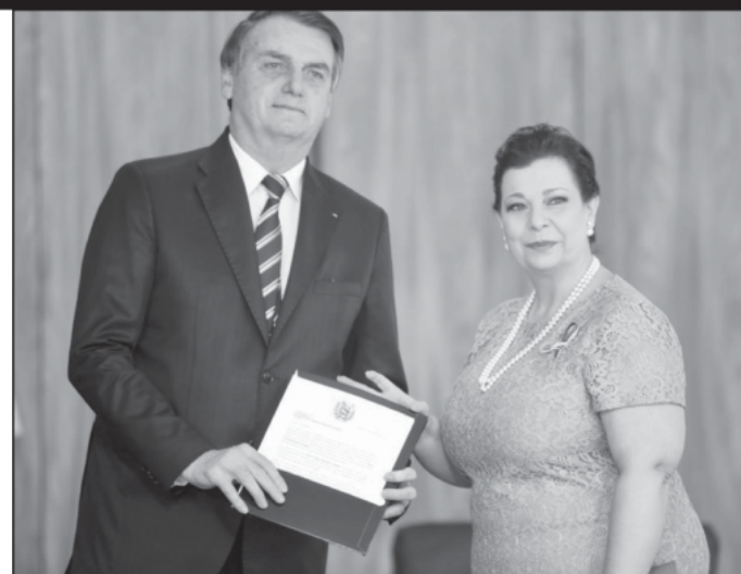
No Palácio do Planalto, a embaixadora da República Bolivariana da Venezuela, Maria Teresa Belandria, entregou as cartas credenciais ao presidente Jair Bolsonaro