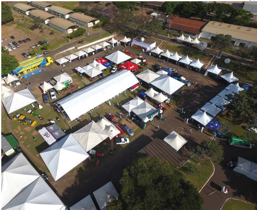
Cerca de 8 mil visitantes são esperados pela Acissp durante os três dias de feira