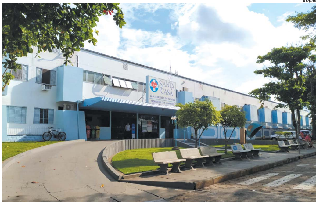
População deve ficar atenta aos novos horários e ainda nos locais de acesso para visitação aos pacientes internados na Santa Casa

MGI abre edital para venda de chácara em Paraíso