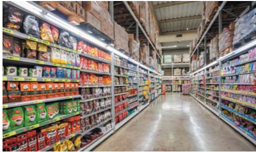
WhatsApp é o novo canal de atendimento do Tonin para clientes pessoa jurídica

Voltado exclusivamente para vendas no atacado de pequenos, médios ou grandes volumes, o aplicativo de troca de mensagens foi implantado para facilitar e agilizar ainda mais o atendimento desse público. "A multicanalidade é uma questão muito importante para nós, pois queremos estar nos mais diversos canais para atendermos os clientes da forma que eles preferirem. Como o WhatsApp é um meio de comunicação bastante utilizado por todo mundo, nada mais natural do que termos mais essa opção de atendimento aos consumidores pessoa jurídica",