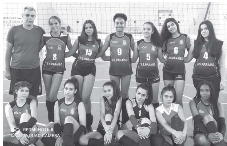
Time das meninas de Paraíso tem feito boas apresentações e estão em duas finais consecutivas

A equipe do sub 14 de vôlei de Paraíso também está em