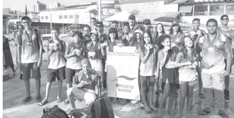
Atletas integrantes da equipe do "Projeto Nadar" de Paraíso conquistaram várias medalhas e índices de tempo positivo

No sábado dia 12/11 a equipe de base da Natação OVTC foi até Passos disputar o 2º Torneio Regional pela Federação Aquática Mineira. Com 29 atletas de todas as categorias de base (8 a 18 anos) a equipe conquistou dezenas de medalhas e muitos