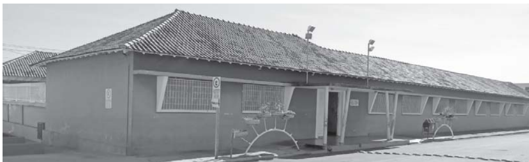
Escola Municipal São Tomás de Aquino

Desta forma motivo de comemoração. Parabéns a toda equipe que conduziu o trabalho com empenho, dedicação, alcançando o sucesso.