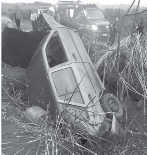
Acidente registrado na Rodovia Pedro Cerize. Cinco pessoas ficaram feridas

O fim de semana foi movimentado para socorristas do 2º Pelotão de Bombeiros Militares em São Sebastião do Paraíso. Foram pelo menos cinco ocorrências entre os dias 16 e 18 de outubro (de sexta a domingo) envolvendo acidentes no perímetro urbano e, também, em rodovias da região. Em todas as ocorrências, algumas vítimas foram socorridas em estado grave.