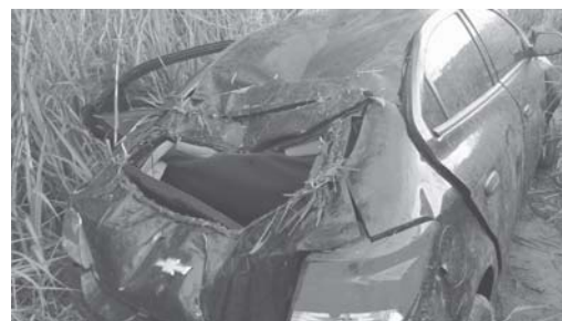
Vítima de acidente na MG-050, no sábado, foi socorrida e transporta a Itaú de Minas, onde reside

No fim da tarde do mesmo dia, às 17h47, na rodovia Pedro Luiz Cerize, próximo ao bairro rural dos Pimentas, o condutor perdeu o controle direcional do veículo que saiu da pista e deixando cinco pessoas feridas. Segundo informações do Corpo de Bombeiros, o condutor afirmou que o acidente aconteceu no momento em que ele acendia um cigar-