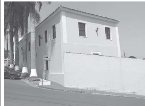
Prédio da ex-cadeia pública