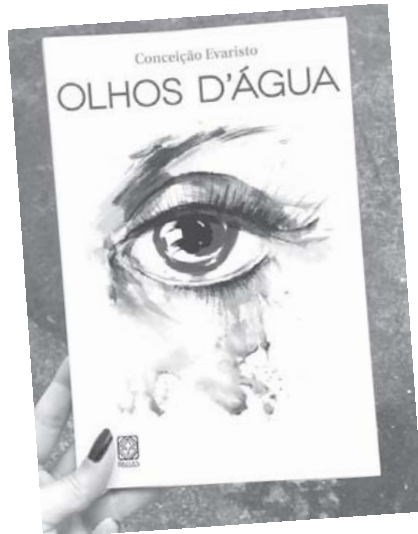
Olhos d'água, de Conceição Evaristo. Autora foi homenageada da Olimpíadas de Língua Portuguesa 6ª edição neste ano

"Um exemplo é a mundialmente conhecida J. K. Rowling, autora de Harry Potter, que, no início da sua carreira, começou a mandar o manuscrito da sua obra para editoras apenas com iniciais e seu sobrenome como conselho de sua editora para ser publicada e despertar interesse dos leitores. Ou seja, uma forma de apagar o gênero da autora. Assim, a hashtag é importante para mostrar a importância das escritoras e valorizar suas obras, estimulando a leitura e discussão das mesmas", ressalta.