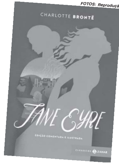
Jane Eyre, de Charlotte Brontë, é um clássico do século XIX e discute temas importantes como o espaço da mulher na Era Vitoriana

Para próxima reunião a obra elegida pelo clube foi um clássico da literatura britânica, Jane Eyre de Charlotte Brontë, obra mais conhecida da autora, publicada em 1847. O livro em questão traz uma crítica social e moral, colocando-se não só à frente de seu tempo, mas sendo, ainda, uma leitura atual ao apresentar como protagonista um mulher forte e independente.