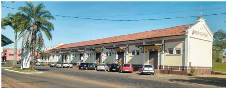
Na Casa da Cultura, os Funcionários, o Prédio e Relíquias Históricas, precisam de maior segurança e receberem melhores cuidados