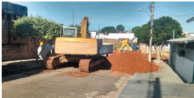
Nesta semana, prefeitura iniciou obra de canalização de águas pluviais em Ruas do Jardim Acazulco que estavam paralisadas a oito anos