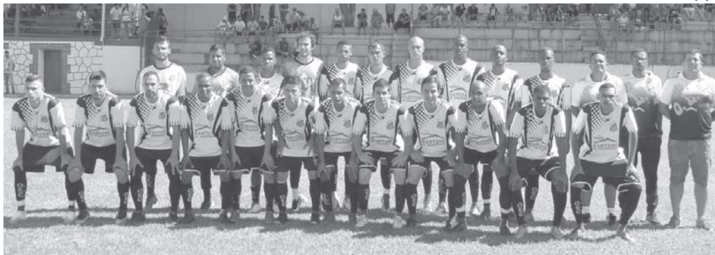
Time de Paraíso é um dos destaques do campeonato e tem grandes chances de classificar-se para segunda fase