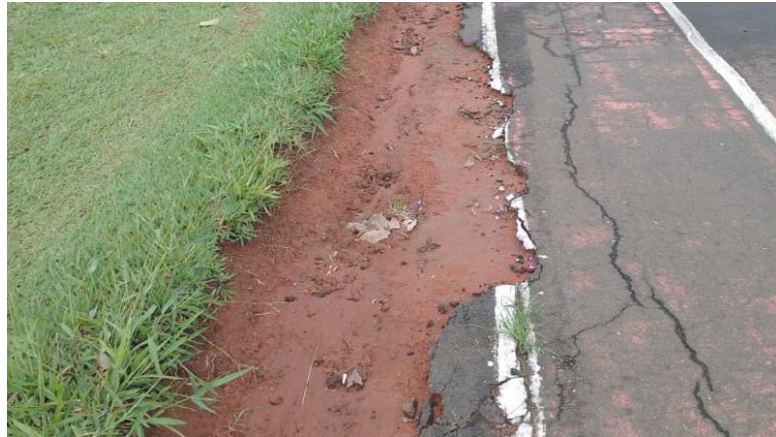
Devido ao corte irregular do gramado no Campo da Praça de Esportes Mons. Mancini, está danificando a pista asfáltica do Atletismo