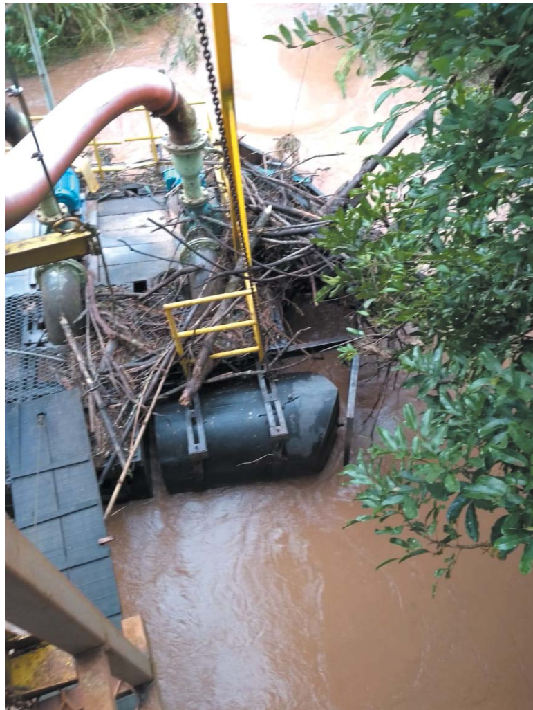
Forte chuva causou novos danos na balsa, vindo a molhar motores