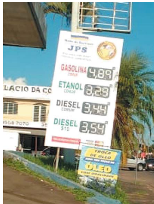
No posto JPS localizado na Av. Brasil, no Parque São Judas Tadeu, onde se vende o litro do Etanol e Diesel mais barato em Paraíso

Enquanto a renda da população brasileira cai, sobem os