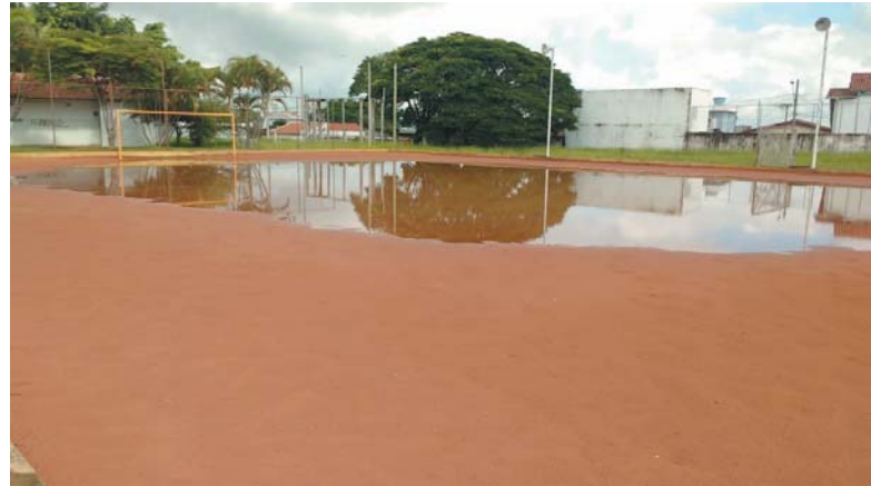
Acúmulo de água de chuva dentro do campo de terra da Praça de Esportes Mons. Mancini, está dificultando os usuários