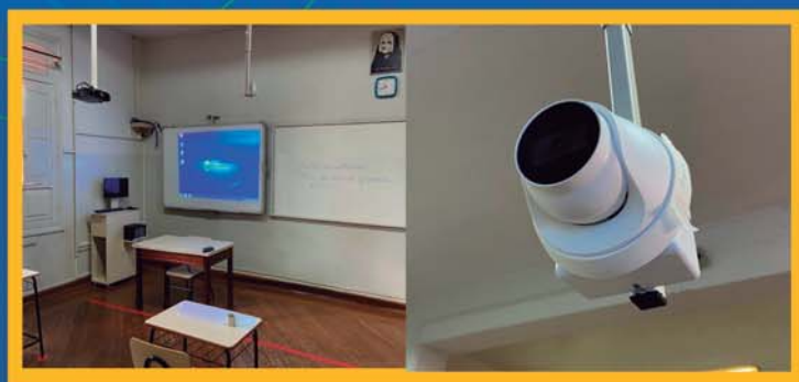
AULAS SIMULTÂNEAS PRESENCIAIS E ON-LINE DO INFANTIL DE 5 ANOS AO TERCEIRÃO – ENSINO MÉDIO.