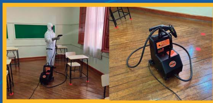
INTENSIFICAÇÃO NA DESINFECÇÃO GERAL COM A MÁQUINA NEW JOKER (ATOMIZAÇÃO TÉRMICA COM CARGA ELÉTRICA E JATO DE ÁGUA VAPORIZADA).